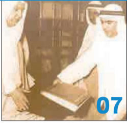
دستور الكويت... 51 سنة في مسيرة الحكم الديمقراطي