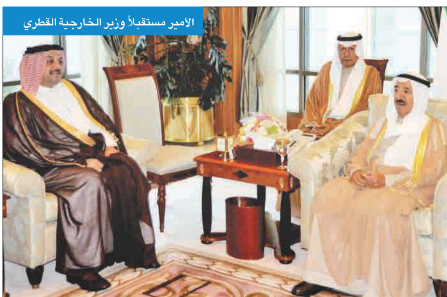
الأمير مستقبلاً وزير الخارجية القطري

وبعث سمو ولي العهد الشيخ نواف الأحمد، وسمو رئيس مجلس الوزراء الشيخ جابر المبارك ببرقيتي تعزية مماثلتين.