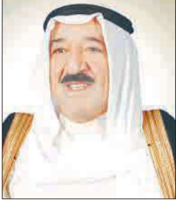
الأمير يتسلم رسالة من تميم بن حمد وبلتقي لاغارد