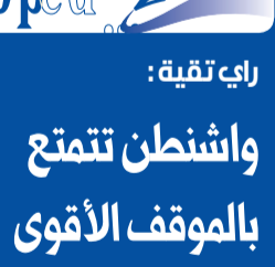
واشنطن تتمتع بالموقف الأقوى في المفاوضات النووية لا إيران