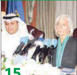
لاغارد: الاقتصاد الكويتي بدأ يستنفذ موارده النفطية