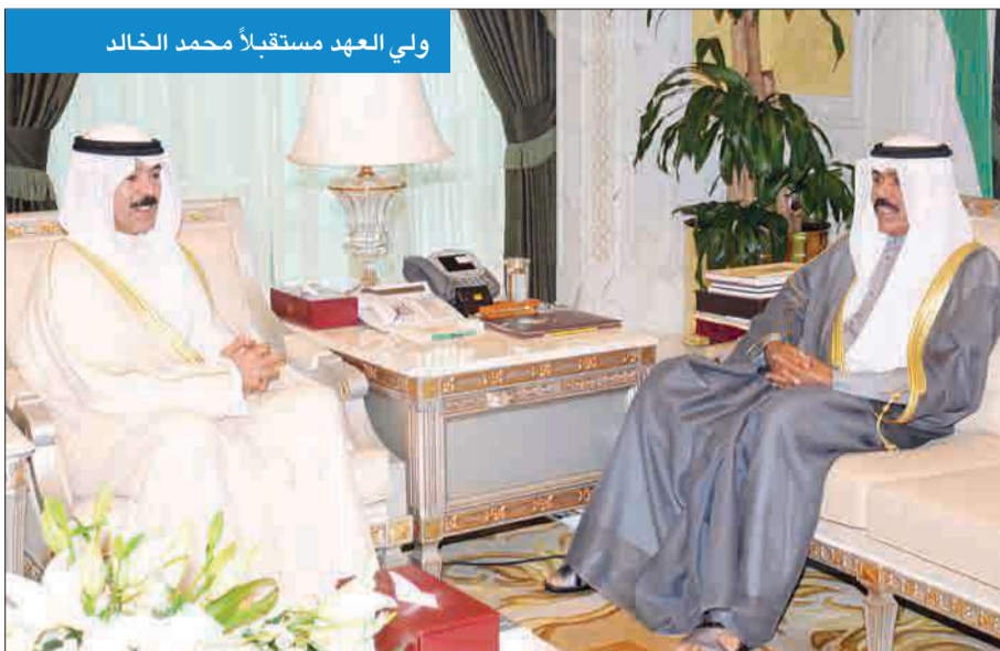
ولي العهد مستقبلاً محمد الخالد

استقبل سمو ولي العهد الشيخ نواف الأحمد في ديوانه بقصر السيف صباح أمس، رئيس مجلس الأمة مرزوق الغانم. واستقبل سموه أيضاً، نائب رئيس مجلس الوزراء وزير الدفاع الشيخ محمد الخالد، ثم نائب رئيس مجلس الوزراء وزير الدفاع الشيخ خالد الجراح. كما استقبل سموه، وزير الإعلام وزير الدولة لشؤون الشباب الشيخ سلمان الحمود، ثم وزيرة الدولة لشؤون مجلس الأمة ووزيرة الدولة لشؤون التخطيط والتنمية الدكتورة رولا دشتي.