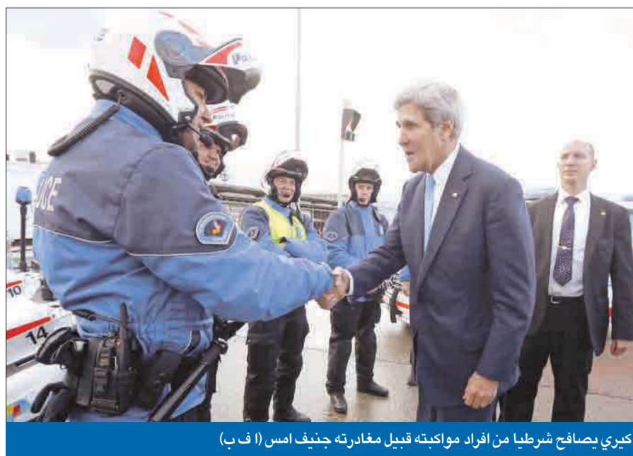
كيري يصافح شرطياً من أفراد مواكبته قبيل مغادرته جنيف أمس

كيري: لسنا أغبياء ونعرف كيف نحافظ على مصالح حلفائنا