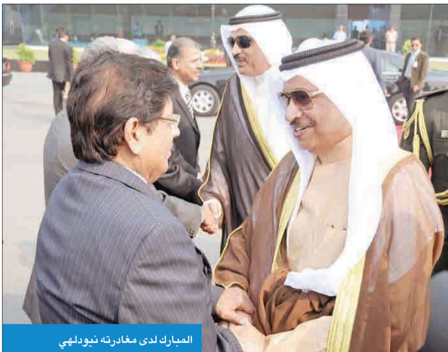
المبارك لدى مغادرته نيودلهي

العريقة بين البلدين وسبل تعزيزها وتتميتها بما يحقق مصالح البلدين والشعبين. ووقع البلدان خلال الزيارة خمس اتفاقيات ومذكرات تفاهم في شتى المجالات.