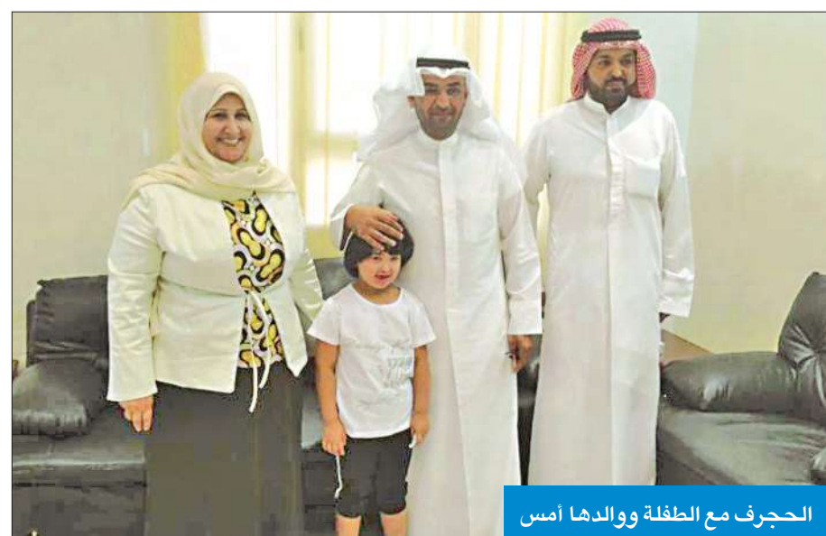
الحجرف مع الطفلة ووالدها أمس

أكد وزير التربية د. نايف الحجرف أن إجراءات حازمة ستتخذ في حق المعلمات اللاتي قمن بتصوير الطالبات والسخرية منهن.