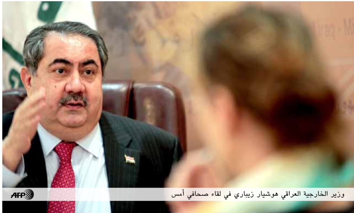
وزير الخارجية العراقي هوشيار زيباري في لقاء صحافي أمس

باجتماع الزعماء، وذلك بسبب تعليق عضويتها في لقاءات الجامعة العربية.