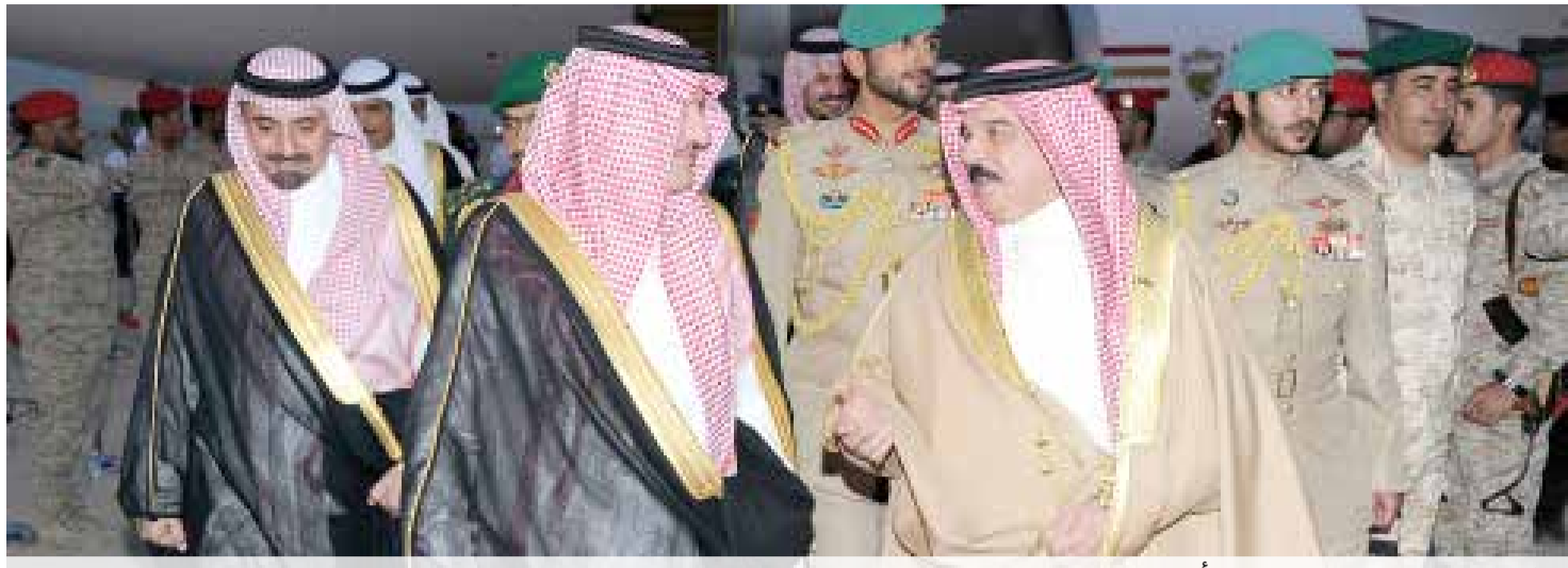
عاهل البلاد لدى وصوله السعودية أمس