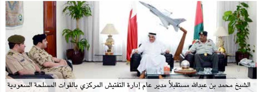
الشيخ محمد بن عبدالله مستقبلاً مدير عام إدارة التفيتش المركزي بالقوات المسلحة السعودية

□ استقبل أمير دولة الكويت الشقيقة صاحب السمو الشيخ صباح الاحمد الجابر الصباح بقصر السيف صباح يوم امس الاثنين (28 أبريل/ نيسان 2014)، وبحضور ولي العهد سمو الشيخ نواف الاحمد الصباح ووزير الاعلام ووزير الدولة لشؤون الشباب الشيخ سلمان صباح سالم الحمود الصباح، وزيرة الدولة لشؤون الاعلام المتحدث الرسمي باسم الحكومة سميرة رجب وصاحب السمو الملكي الامير بدر بن عبدالمحسن بن عبدالعزيز آل سعود ووزير الاعلام بجمهورية مصر العربية الشقيقة درية شرف الدين والوزراء المشاركين في «الملقى الاعلامي العربي الحادي عشر» الذي بدأ أعماله امس الاول الاحد تحت شعار «تحويلات وتحديات».