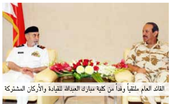
القائد العام ملتقاً وفداً من كلية مبارك العبدالله للقيادة والأركان المشتركة

اجتمع القائد العام لقوة دفاع البحرين المشير الركن الشيخ خليفة بن أحمد آل خليفة في مكتبه بالقيادة العامة صباح يوم أمس الأحد (6 مايو/ أيار 2012م) في مكتبه بالقيادة العامة، مع وفد من كلية مبارك العبدالله للقيادة والأركان المشتركة رقم 16/ بدولة الكويت الشقيقة، وذلك بمناسبة زيارته لمملكة البحرين.