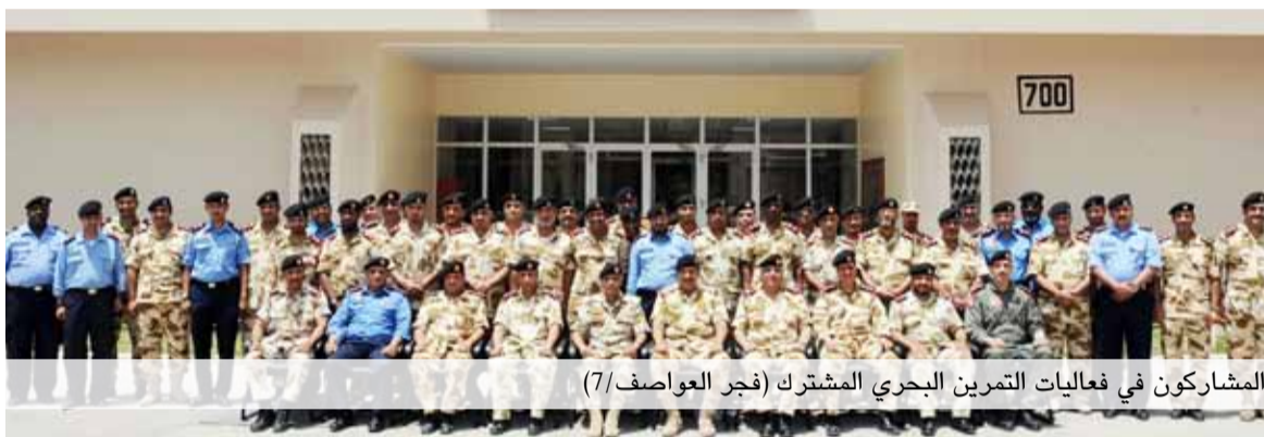
المشاركون في فعاليات التمرين البحري المشترك «فجر العواصف/7»

اختتمت صباح يوم أمس الأحد (6 مايو/ أيار 2012م) فعاليات التمرين البحري المشترك «فجر العواصف/7»، والذي نفذته سلاح البحرية الملكي البحريني بمشاركة وحدات من قوة دفاع البحرين وخفر السواحل من وزارة الداخلية، بحضور مساعد رئيس هيئة الأركان للعمليات اللواء الركن ذياب صقر النعيمي، ويأتي هذا التمرين في إطار خطة مرسومة تهدف إلى التدريب والتأهيل ورفع كفاءة المشاركين.