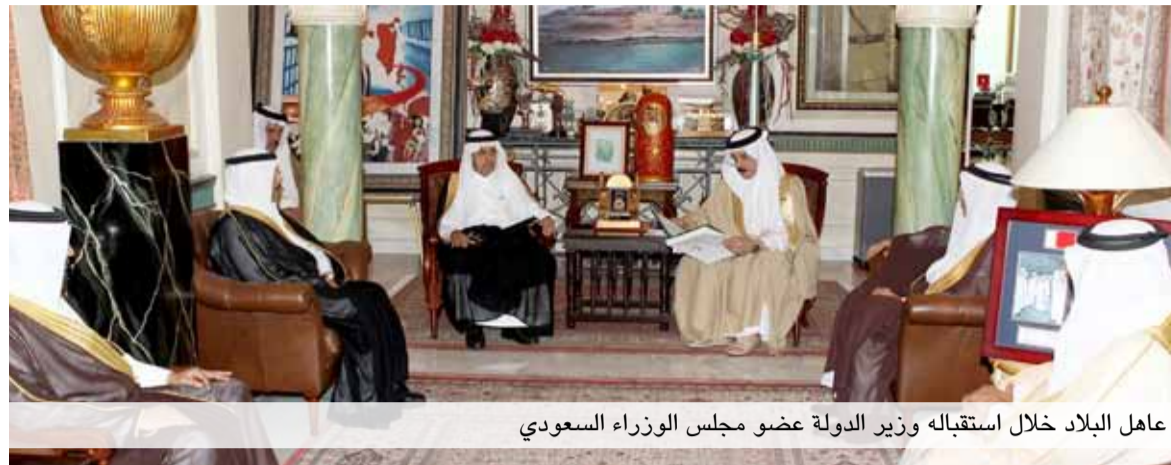
عاهل البلاد خلال استقباله وزير الدولة عضو مجلس الوزراء السعودي

تسلم عامل البلاد حضرة صاحب الجلالة الملك حمد بن عيسى آل خليفة، رسالة خطية من أخيه عاهل المملكة العربية السعودية الشقيقة خادم الحرمين الشريفين الملك عبدالله بن عبدالعزيز آل سعود، تتعلق بالعلاقات التاريخية المتميزة القائمة بين البلدين الشقيقين وتعزيز مسيرة التعاون بين دول مجلس التعاون لدول الخليج العربية، والقضايا موضع الاهتمام المشترك. وسلم الرسالة إلى جلالته الملك وزير الدولة عضو مجلس الوزراء السعودي مطلب بن عبدالله النفيسه، وذلك خلال استقبال جلالته له أمس الأحد (6 مايو/ أيار 2012) بقصر الصافية. وأشاد جلالته الملك بدور المملكة العربية السعودية