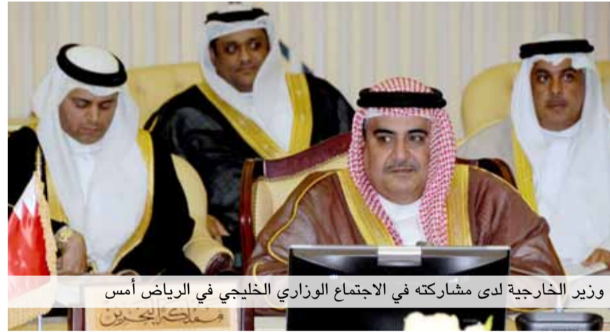
وزير الخارجية لدى مشاركته في الاجتماع الوزاري الخليجي في الرياض أمس

من خلال الرؤية التي تقدمت بها لتطوير مجلس التعاون لدول الخليج العربية في قمة الكويت العام 2009. وقال الشيخ خالد بن أحمد بن محمد آل خليفة، في تصريح له قبيل اللقاء التشاوري الـ 14 للمجلس الأعلى لمجلس التعاون لدول الخليج العربية في الرياض: «إن غاية الشعوب الخليجية هي تحقيق الوحدة المشتركة تنويجاً لما يربط بينهم من روابط أخوية وثيقة شكلت مصدر قوة الأسرة الخليجية الواحدة، كما أن التوصل إلى صيغة اتحادية بين دول المجلس ستحسّن المنطقة من أي تهديدات أو أفعال خارجية غير مسؤولة، وخاصة في ظل ما يشهده العالم من متغيرات كبيرة». ونوه إلى أنه وفقاً لنص المادة (4) من النظام الأساسي لمجلس التعاون؛ فإن الوحدة الخليجية تبقى هي الهدف الأسمى والغاية النهائية المأمول تحقيقها بجهود ومساعي القادة الخليجين وتوجيهاتهم السديدة في هذا الشأن.