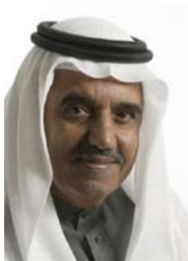
مراد علي مراد

□ كشف رئيس مجلس إدارة بنك البحرين والكويت مراد علي مراد، أن البنك حقق أرباحاً صافية بلغت 31.3 مليون دينار لفترة الأشهر التسعة الأولى من العام المنتهية في 30 سبتمبر/أيلول 2010، وهي أعلى بنسبة 25 في المئة مقارنة بالفترة نفسها من العام الماضي. وقال مراد: «إنه وبالرغم من المخصصات العامة المتحفظة التي اتخذها البنك خلال هذا العام، إلا أنه تمكن من تحقيق نتائج إيجابية خلال هذه الفترة». مؤكداً على «تعزيز الاحتياطي العام واحتياطي المخصصات العامة في مقابل أصوله بهدف تقوية قدرته على التصدي لأية