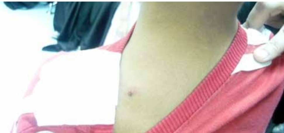
آثار طلقات الشوزن واضحة في أجسام الأطفال