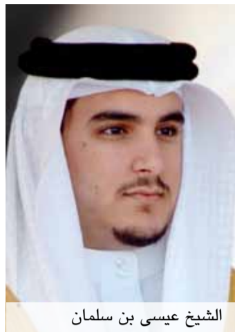
الشيخ عيسى بن سلمان

يرفع مجلس الأمناء تقريراً سنوياً إلى الديوان الملكي عن نشاط المجلس وسير العمل بالوقف، يتضمن ما تم إنجازه، وفقاً للخطة والبرامج الموضوعية، وتحدد فيه مواعيد الأداء والحلول المقترحة لتفاديها.