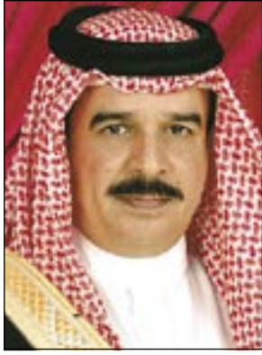
عاهل البلاد المفدى

□ أشاد عامل البلاد جلالته الملك حمد بن عيسى آل خليفة بمبادرة عاهل المملكة العربية السعودية خادم الحرمين الشريفين الملك عبدالله بن عبدالعزيز آل سعود بعقد الحوار رفيع المستوى بشأن