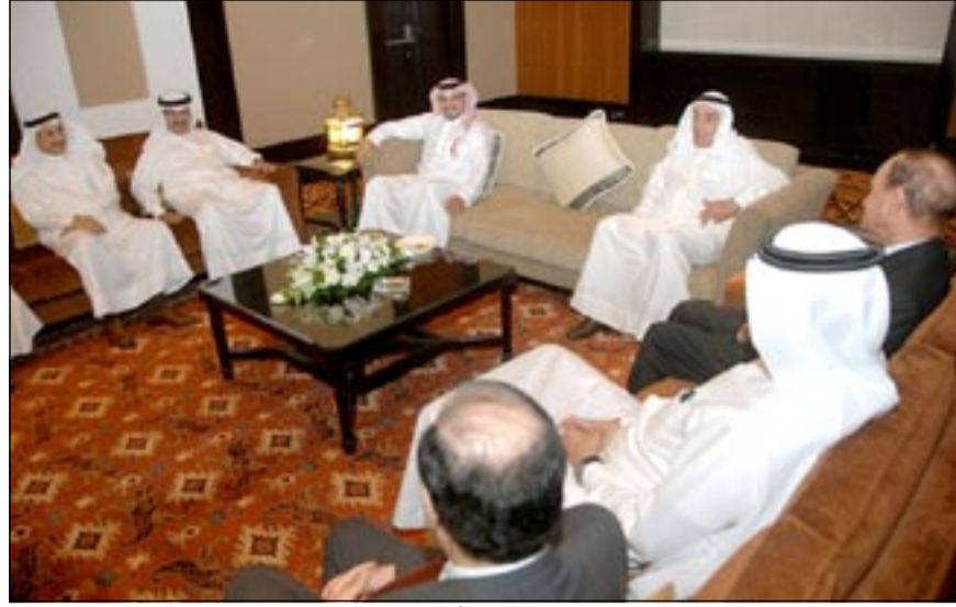
سمولي العهد مع اجتماع الوزراء أمس

كما أشادت القيادة في برقيتها بالدور والجهود التي يقوم بها خادم الحرمين الشريفين في خدمة قضايا الأمة الإسلامية وتعزيز التضامن والتعاون بين دولها من أجل تحقيق الأهداف المنشودة.