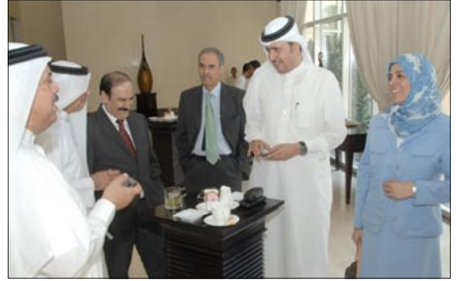
عدد من الوزراء في حديث جانبي على هامش الاجتماع