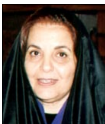
قرينة عاهل البلاد