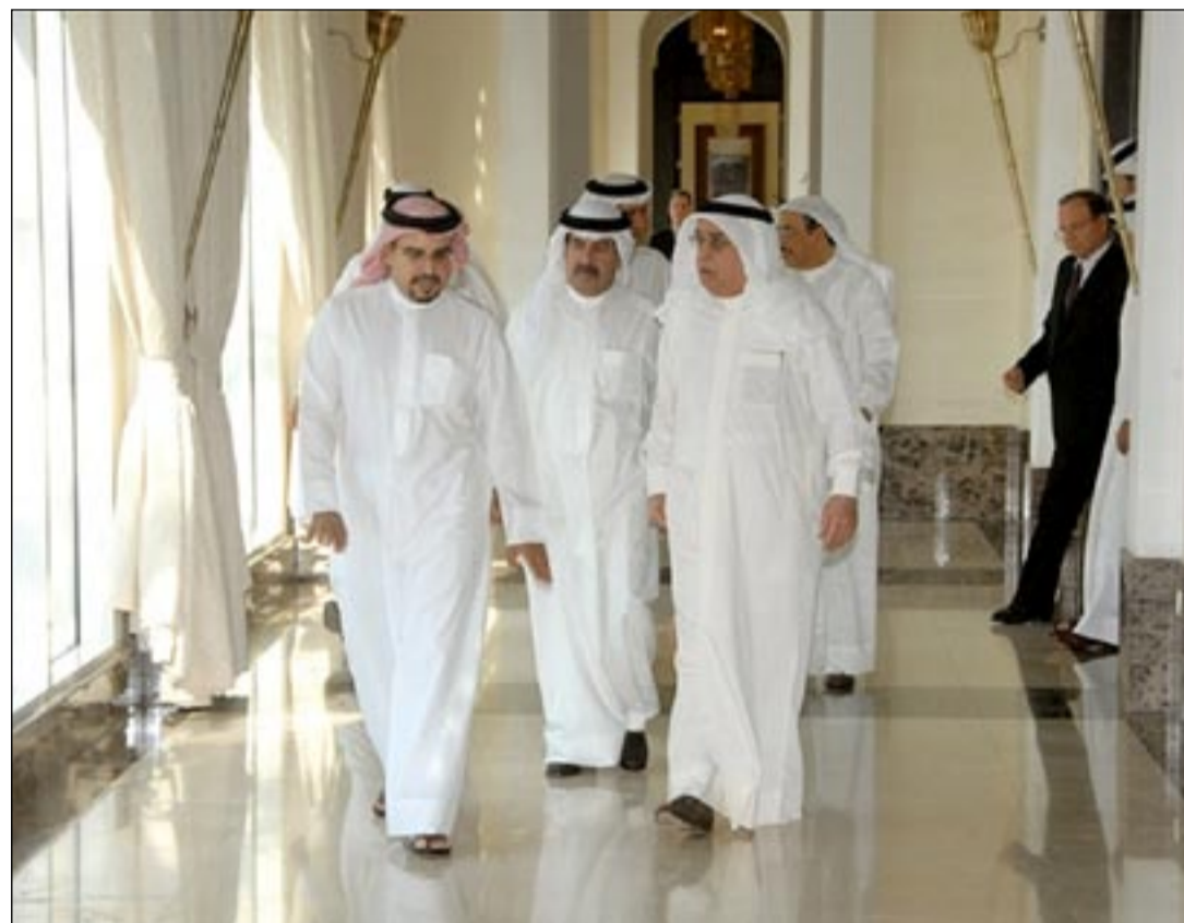
سمولي العهد مع نائب رئيس مجلس الوزراء