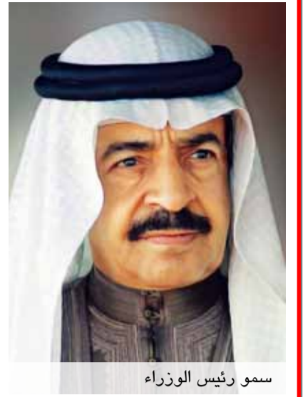
سمو رئيس الوزراء