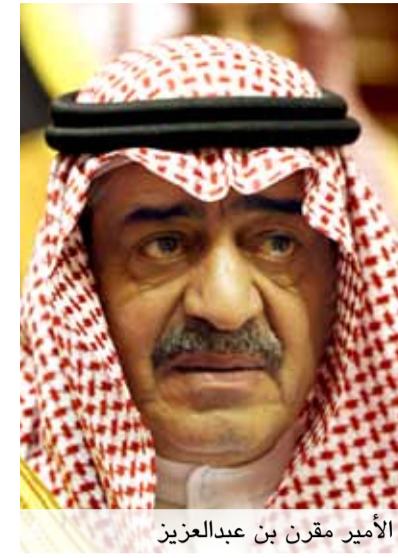
الأمير مقرن بن عبدالعزيز

وشدد رئيس مجلس الشيوخ الفلبيني على تعزيز آفاق التعاون البحريني الفلبيني في مختلف الميادين، ولاسيما المجال البرلماني، لافتاً إلى أن البرلمان الفلبيني يعمل على خلق تعاون دائم مع المجالس التشريعية الخليجية بهدف تعزيز روابط الصداقة، ومشيراً إلى أن هذه العلاقات من شأنها أن تسهم في خلق بيئة فاعلة لبناء علاقات