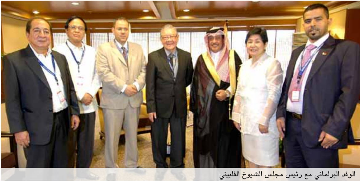
الوفد البرلماني مع رئيس مجلس الشيوخ الفلبيني