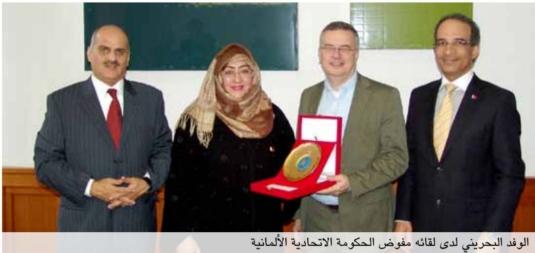
الوفد البحريني لدى لقائه مفوض الحكومة الاتحادية الألمانية

وبالتالي فالمعادلة تتطلب وعياً لدى جميع القوى المجتمعية بضرورة الموازنة بين متطلبات الالتزام بتطبيق مفهوم حقوق الإنسان والالتزامات الدولية في هذا الشأن وعدم الانجراف وراء الشعارات أو التحديات التي تواجه الأمن والاستقرار والتنمية في الدولة.