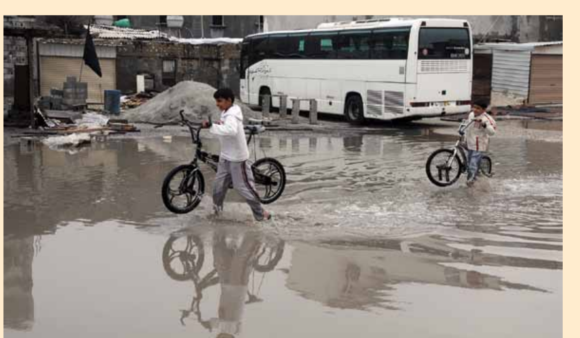
أولياء الأمور يجدون صعوبة في توصيل أبنائهم للمدرسة بسبب الأمطار في مدينة عيسى