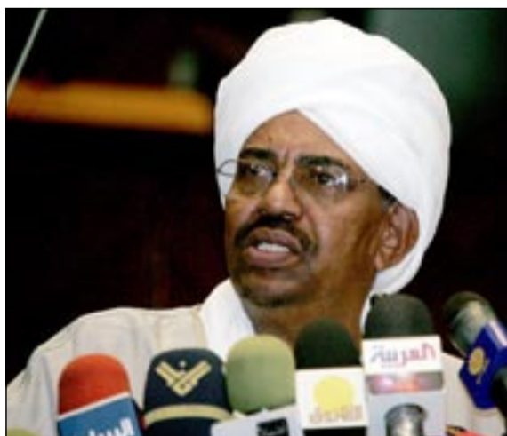
البشير خلال خطابه في البرلمان بالخرطوم

■ الخرطوم - سونا، دب أكد الرئيس السوداني عُمر البشير أمس (الاثنتين) عزم حكومته على دفع مسيرة التراضي والوفاق الوطني وأعلن عن انطلاق مسيرة مبادرة أهل السودان لحل قضية دارفور الخميس المقبل.