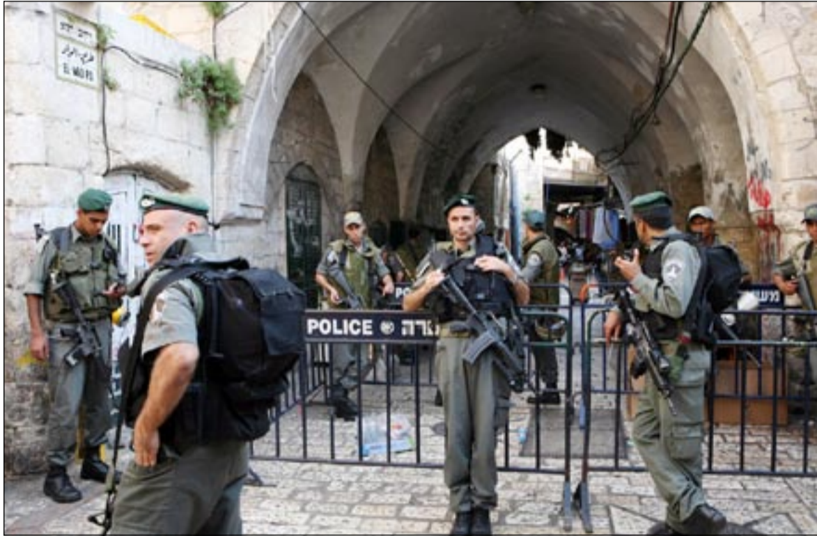
جنود إسرائيليون في نقطة تفتيش بمدينة القدس المحتلة

من جهة أخرى، أعادت السلطات المصرية أمس فتح معبر رفح الحدودي من جانب واحد لإخلاء دفعة جديدة من المعتقلين وعدد من المرضى الذين أتوا لعلاجهم في مصر.