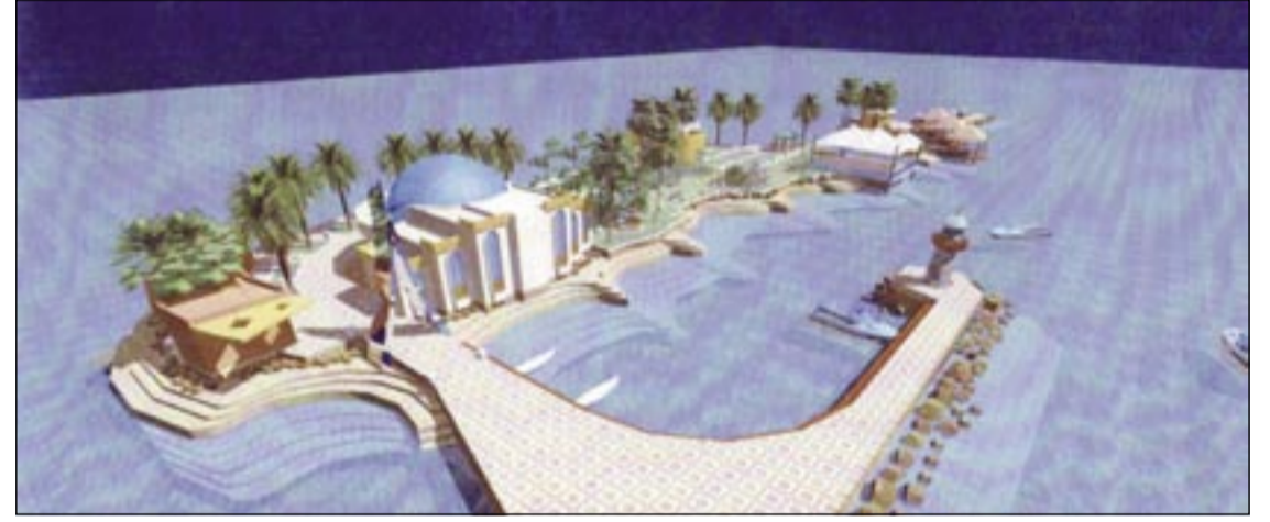
رسم تخيلي لمشروع جزيرة الشيخ إبراهيم في عسكر

كشفت إدارة الأوقاف الجعفرية، أن تطوير جزيرة الشيخ إبراهيم ضمن مشروع سياحي ديني لايزال في انتظار موافقة وزارة العدل والشؤون الإسلامية منذ أكثر من 4 أربعة أعوام، وذلك بعد أن رفعت الأوقاف الجعفرية تصوراً شاملاً للمشروع بكلفة نحو 2 مليون دينار منذ ذلك الحين. وأشارت «الأوقاف الجعفرية» إلى أن الوقت الإجمالي للانتهاء من إنجاز المشروع هو 18 شهراً، وتكون بذلك جزيرة الشيخ إبراهيم مرفأً سياحياً دينياً للبحرين ومنطقة الخليج العربي.