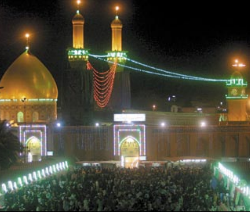
زار مرقد الإمام الحسين (ع) في كربلاء