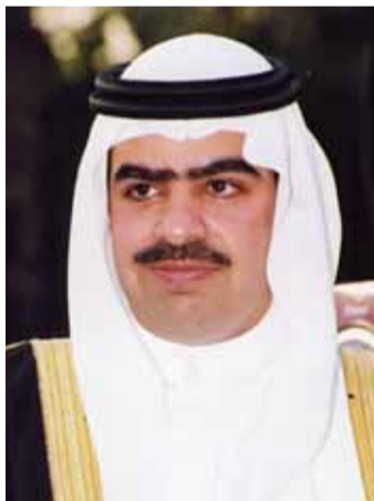
الشيخ فواز بن محمد آل خليفة

إخوتنا في دول المجلس للتعامل معها إن تجددت... وقال خلال حوار مع صحيفة «الجزيرة» إن «مملكة البحرين في الأساس هي دستورية وهناك عدد من السلطات تتناغم وتعمل بشكل متكامل ولدينا تطور دائم لمفهوم الدستورية مثل كل الملكات الدستورية في العالم، ونحن في الحكومة البحرينية نزيهون تماماً، وخذ على سبيل المثال جمعية «الوفاق» دخل أعضاؤها الانتخابات وفازوا جميعاً. وليس لدينا نية على الإطلاق في تخفيف تمثيل المعارضة والحماية الدستورية مكفولة للجميع، ولكن بعض الناس اختلطت لديهم الأمور.» وأضاف «لأسف لم نر للمحتجين مطالبات في البرلمان، ولم نرهم سوى في الشوارع والمظاهرات، للأسف الشديد أيضاً أن أولئك المحتجين والمخربين أرادوا تجريد البحرين من قيمتها الدستورية وأرادوا أيضاً شل الحركة القانونية الدستورية، ولعلمكم شاهدتم أعمالهم مثل احتلال مستشفى له حصاته وتحويله إلى مركز عمليات لهم يخططون خلاله للعبث بأمن واستقرار البلاد.»