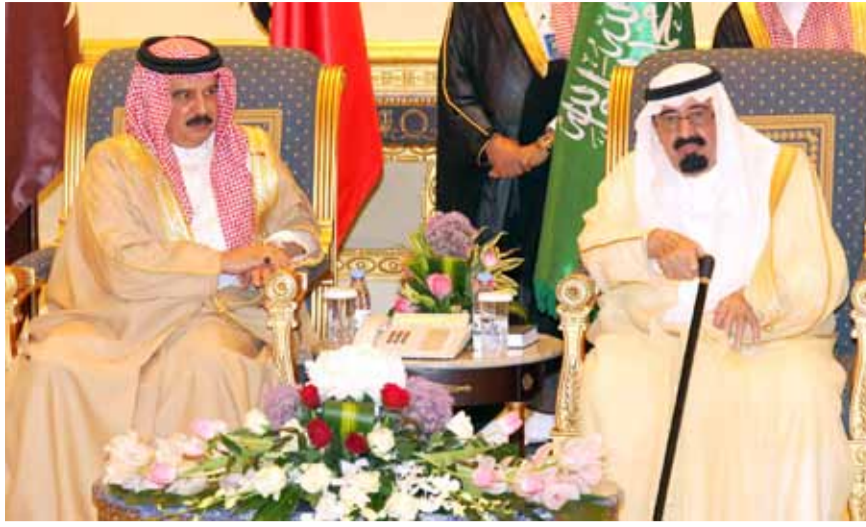
العاهل السعودي مستقبلاً جلالة الملك