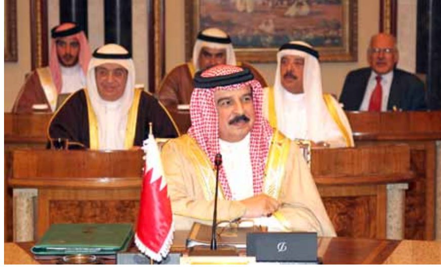
جلالة الملك لدى مشاركته في الاجتماع التشاوري الخليجي في الرياض

تسلم وزير الخارجية الشيخ خالد بن أحمد بن محمد آل خليفة بالديوان العام لوزارة الخارجية صباح أمس نسخة من أوراق اعتماد سفير مملكة تايلند لدى البحرين فيكال فاراسيفيكول. وأعرب الوزير عن تمنياته للسفير بالتوفيق والنجاح في مهمات عمله بما يسهم في تعزيز أواصر الصداقة وعلاقات التعاون بين مملكتي البحرين وتايلند. من جانبه أعرب السفير التايلندي عن سعاده بتتمثيل بلده لدى مملكة البحرين وأشاد بسياسة عاهل البلاد جلالة الملك حمد بن عيسى آل خليفة وبالمكانة المرموقة التي تحتلها المملكة في المجتمع الدولي.