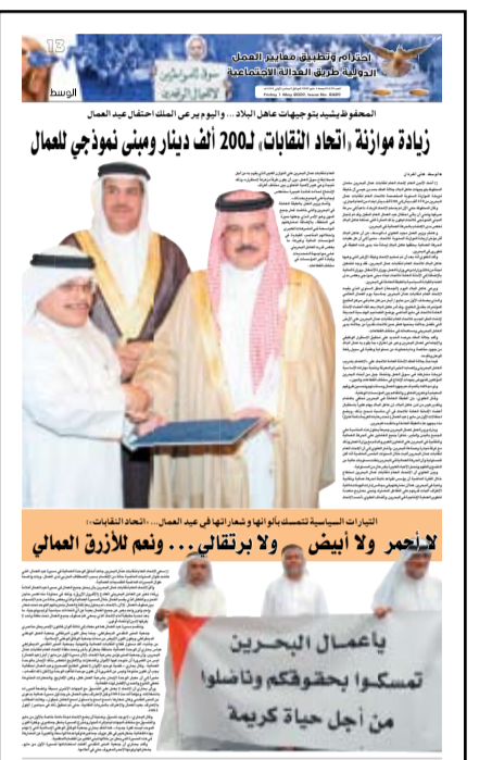
زيادة موازنة اتحاد النقابات، 200 ألف دينار ومبنى نموذجي للعمال

وأكد العلوي أنه بعد أن تم تسليم الاتحاد وثيقة الأرض التي وهبها عاهل البلاد للاتحاد العام لنقابات عمال البحرين، فقد وجه لتشكيل لجنة من ثلاث وزارات وهي وزارة العمل، وزارة الأشغال، ووزارة المالية بالإضافة إلى الأمانة العامة للاتحاد لبناء مبنى نموذجي يعكس مدى اهتمام القيادة السياسية بالطبقة العاملة في البحرين. (التفاصيل ص13 و14 و15 و16)