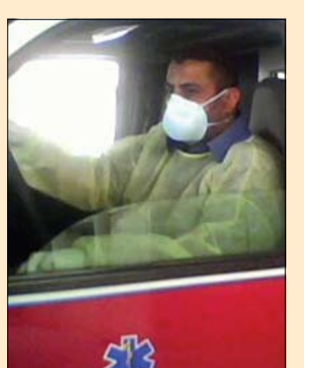
مسعف بحريني يضع كمادة للوقاية

الوسط - علياء علي أعلن وزير الصحة فيصل الحمر أن النتائج المخبرية لأول حالة مشتبه بإصابتها بانفلونزا الخنازير في البحرين جاءت سلبية، وقال الحمر: «إن الحالة كانت لمسافر أميركي يبلغ من العمر 41 عاماً قادم مساء أمس من الولايات المتحدة عن طريق مطار فرانكفورت الدولي إلى البحرين». وأشار الحمر إلى أن المريض سيغادر العزل في اليوم نفسه ليتلقى العلاج في أحد المستشفيات الخاصة. إلى ذلك، قالت مصادر مطلعة لـ «الوسط» إن وزارة الصحة تنوي شراء التحليل اللازم للكشف عن «انفلونزا الخنازير» الذي يتوقع أن تطرحه شركات الأدوية