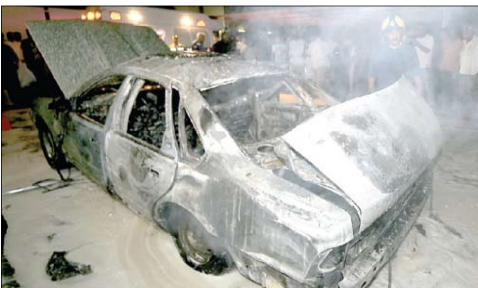
رجال الدفاع المدني يحمدون الحريق الذي اشتعل في السيارة