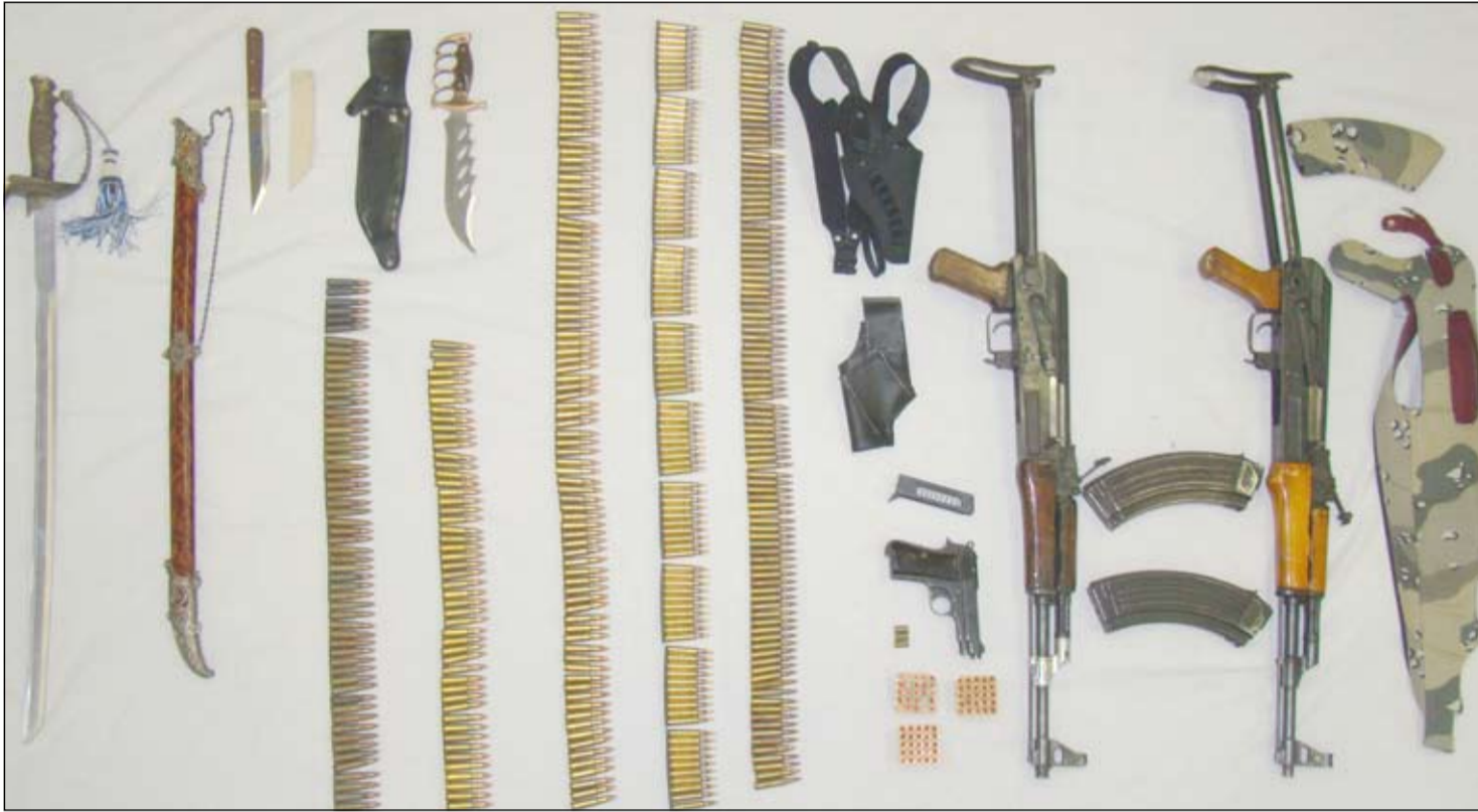
صورة الأسلحة التي اكتشفت كما وزعتها وزارة الداخلية أمس

العقد 2429 الجمعة 1 مايو 2009 الموافق 5 جمادى الأولى 1430 هـ