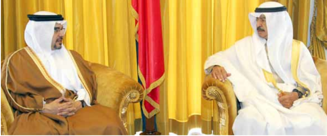
سمو رئيس الوزراء وسمو ولي العهد لدى اجتماعهما أمس

□ أصدر رئيس الوزراء سمو الأمير خليفة بن سلمان آل خليفة وولي العهد نائب القائد الأعلى سمو الأمير سلمان بن حمد آل خليفة توجيهاتهما باتخاذ سلسلة من الإجراءات منها وقدر سوم سوق العمل البالغة عشرة دنانير لكل عامل في المنشأة لمدة ستة أشهر اعتباراً من الأول من أبريل / نيسان الجاري كما وجه سموهما مصرف البحرين المركزي بمخاطبة البنوك العاملة في البلاد لتسهيل أمور رجال الأعمال وبالأخص فيما يتعلق بالديون والفوائد المصرفية. كما وجه سموهما خلال اجتماعهما أمس الأربعاء (6 أبريل 2011) وزارة العمل وهيئة تنظيم سوق العمل لتسهيل الحصول على رخصة البديل من العمال الأجانب الذين غادروا البلاد والتسريع في طرح مناقصات المشروعات الحكومية كي تستمر العجلة الاقتصادية في الدوران. إلى ذلك وجه سموهما وزارة المالية إلى تسريع تسديد الفواتير المستحقة على الجهات الحكومية في قطاعات المقاولات والمشتريات ودعم المواد الغذائية.