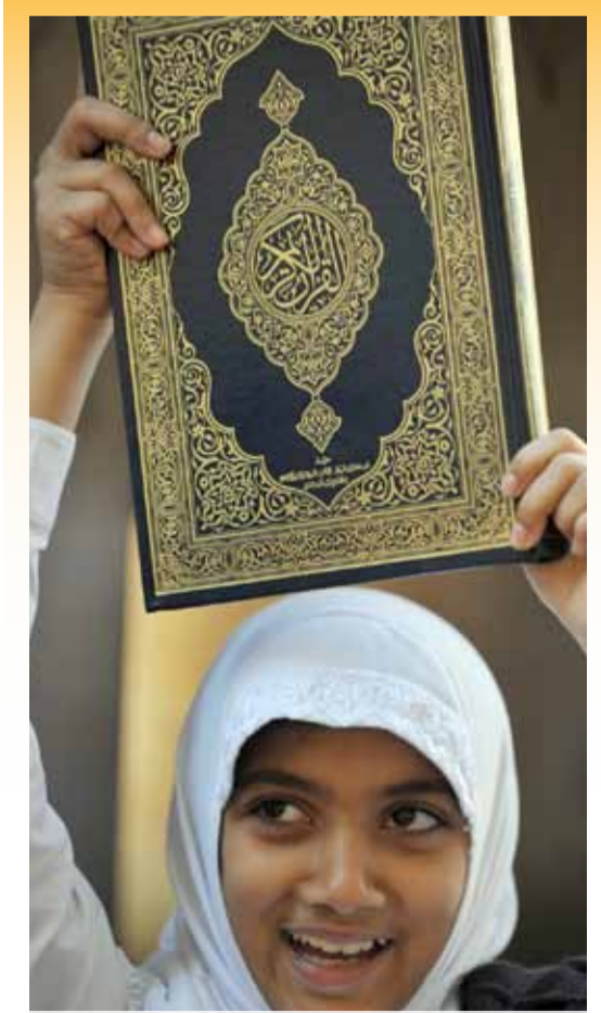
فتاة تحمل القرآن الكريم في استعراض يوم المسلم الأميركي أمس (الإثنين) بمدينة نيويورك، الذي يقام في آخر يوم أحد من شهر سبتمبر من كل عام