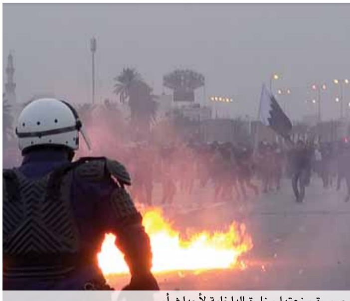
صورة وزعتها وزارة الداخلية لأحداث أمس