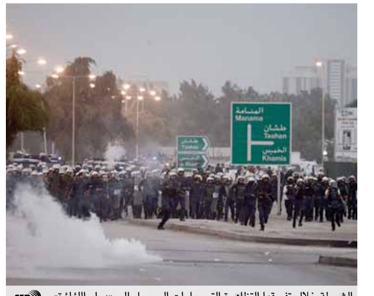
الشرطة خلال تفريقها التظاهرة التي حاولت الوصول إلى «دوار اللؤلؤة»