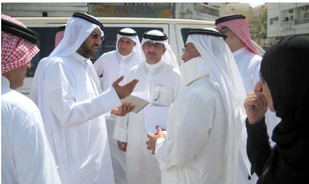
ممثلون عن حماية البيئة خلال زيارتهم المعامير

هذه الخطوة بعد الانتهاء منها الركيزة التي تثبت مدى انبعاث أي ملوثات من المصادر الثابتة.