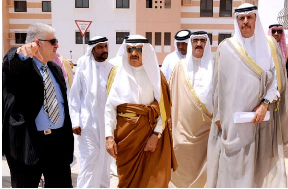
سمو رئيس الوزراء خلال زيارته إسكان البديع أمس

□ أصدر رئيس الوزراء الأمير خليفة بن سلمان آل خليفة وأمر بالإسراع في توزيع الوحدات السكنية التابعة إلى مشروع البديع الإسكاني، والتي تضم نحو 170 وحدة سكنية، كما وجه سموه وزارة الإسكان إلى تنفيذ مشروع إسكاني في جنوسان يضم 150 وحدة سكنية، واتخاذ ما يلزم بشأن ذلك بالتنسيق مع الجهات ذات الاختصاص. □ جاء ذلك خلال الزيارة الميدانية التفقدية المفاجئة التي قام بها سمو رئيس الوزراء صباح أمس (الثلاثاء) إلى قريتي البديع وجنوسان، وذلك استكمالاً لنهج سموه في القيام بالزيارات الميدانية التفقدية لأحوال المواطنين ومتابعة المشروعات الخدمية الحكومية.