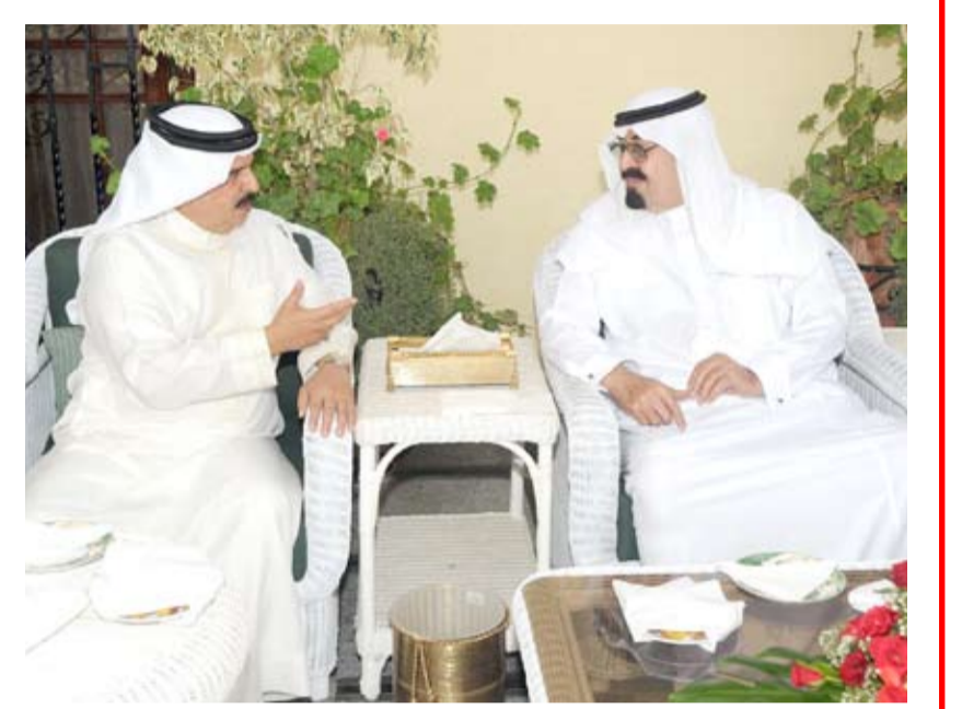
عاهل البلاد خلال لقائه خادم الحرمين الشريفين