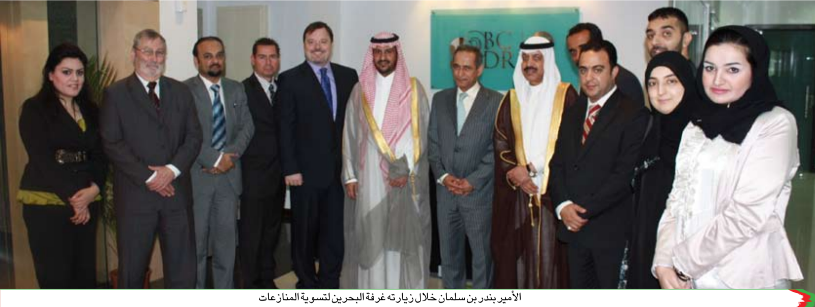
الأمير بندر بن سلمان خلال زيارته غرفة البحرين لتسوية المنازعات

قال مستشار خادم الحرمين الشريفين رئيس فريق التحكيم السعودي صاحب السمو الأمير بندر بن سلمان بن محمد آل سعود: «إن إطلاق أعمال غرفة البحرين لتسوية المنازعات يعد إنجازاً كبيراً لمملكة البحرين، وإن ما رأيناه اليوم خلال هذه الزيارة للغرفة يشير إلى وجود جهود وعمل كبير، مشيداً بالغرفة وما تقدمه من خدمات قانونية متقدمة. جاء ذلك خلال زيارة قام بها الأمير بندر بن سلمان أمس للغرفة برفقة سفير المملكة العربية السعودية لدى البحرين عبدالمحسن بن فهد المارك. واطلع خلال الزيارة على نظام عمل الغرفة وآليات عملها. وقدم الرئيس التنفيذي للغرفة، خلال الزيارة، نبذة تعريفية عن الغرفة بحضور عضو مجلس أمناء الغرفة حسن رضي والمسجلين العاميين للغرفة. وتناول اللقاء عدداً من الموضوعات ذات الاهتمام المشترك فيما يتعلق بموضوع الوسائل البديلة لتسوية المنازعات، وسبل الاستفادة من برامج التعاون وزيارات تبادل الخبرات والتدريب. من جانبه أعرب عضو مجلس أمناء الغرفة حسن رضي عن الترحيب والتقدير لزيارة سمو الأمير مستشار خادم الحرمين الشريفين للغرفة، مشيداً بدور سموه ومساهماته في ميدان التحكيم، كما نقل إلى سمو الأمير بندر تحيات وتقدير رئيس مجلس أمناء غرفة البحرين لتسوية المنازعات الشيخة هيا بنت راشد آل خليفة وأعضاء مجلس الأمناء لهذه الزيارة ودور سموه في دعم مشاريع بدائل تسوية المنازعات ولاسيما التحكيم في المنطقة، معرباً عن تطلع الغرفة إلى مزيد من التعاون المستمر والمثمر.