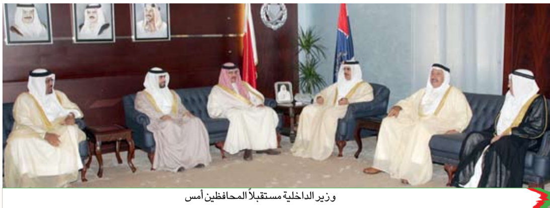
وزير الداخلية مستقبلاً المحافظين أمس

وجه وزير الداخلية الشيخ راشد بن عبدالله آل خليفة الشكر والخفاء إلى محافظي المحافظات وإلى جميع أهالي المحافظات على الجهود الكبيرة والمشاعر الطيبة التي أبدوها في مختلف الفعاليات احتفاءً بزيارة عاهل المملكة العربية السعودية خادم الحرمين الشريفين جلالة الملك عبدالله بن عبدالعزيز آل سعود. جاء ذلك خلال استقبال وزير الداخلية للمحافظين يوم أمس بديوان عام وزارة الداخلية. وأشاد وزير الداخلية الشيخ راشد بن عبدالله آل خليفة بمظاهر الفرحة الغامرة التي سادت كل أهالي المحافظات والتي عبروا فيها عن مشاعر المحبة والتقدير من خلال مختلف الفعاليات والتبرعات. وأشار إلى أن الاستعدادات والترتيبات والاحتفالات التي تمت لهذه الزيارة الكريمة أوضحت أن العمل بالمحافظات