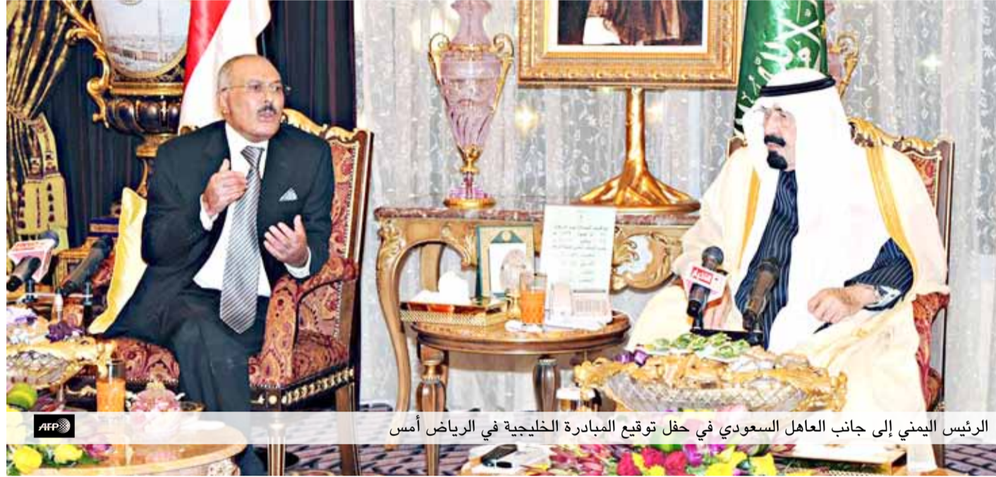
الرئيس اليمني إلى جانب العاهل السعودي في حفل توقيع المبادرة الخليجية في الرياض أمس