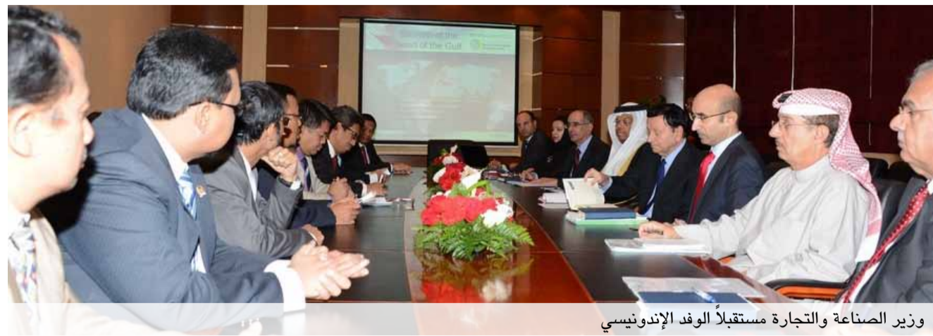
وزير الصناعة والتجارة مستقبلاً الوفد الإندونيسي