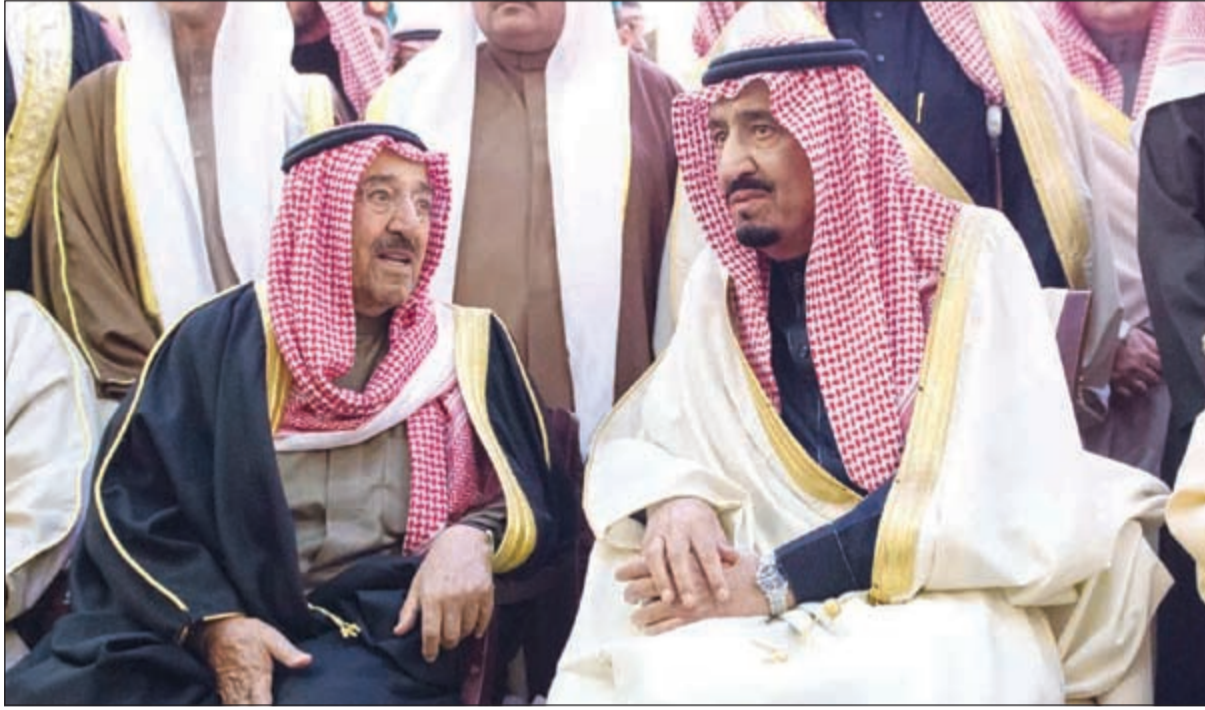
حديث بين صاحب السمو الأمير الشيخ صباح الأحمد وخادم الحرمين الشريفين الملك سلمان بن عبدالعزيز

أكد صاحب السمو الأمير الشيخ صباح الأحمد أن العالم فقد رجلاً عظيماً كما فقدت الأمة العربية والإسلامية أحد قادتها البارزين، حيث كرس جل حياته لخدمة وطنه وشعبه وأمتيه العربية والإسلامية وسخر جهده لتعزيز التضامن العربي والإسلامي والسعي إلى الحفاظ على وحدة الصف والكلمة ونهضة الخلاف والفرقة والتطرف، فكان الملك عبدالله بن عبدالعزيز، رحمه الله، صرحاً شامخاً متحلياً دائماً بالحكمة والحكمة وسداد الرأي في معالجة الأزمات التي واجهتها الأمة العربية والإسلامية والدفاع عنها فلم تكن جهوده مقتصرة على أبناء وطنه بل سخرها لخدمة العرب والمسلمين.