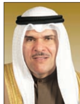
الشيخ سلمان الحمود

ولي عهد الأمين وسمو رئيس مجلس الوزراء، وأضاف أن الحكومة تولي شريحة الشباب اهتماماً كبيراً وتوفر لهم الفرص المناسبة للمساهمة في بناء وتنمية البلاد، مبيّناً أن ذلك لا يتأتى إلا من خلال الاهتمام بالجانب التربوي فلا يمكن أن تطور مجتمعاتنا وننافس وننتج إلا إذا كان نظامنا التربوي قائماً على أسس علمية صحيحة وعصرية وتطويرية والمهارات والقدرات العلمية للطلاب. وأشار إلى أن للأسرة دوراً أساسياً في تنشئة جيل المستقبل وتواصلهم