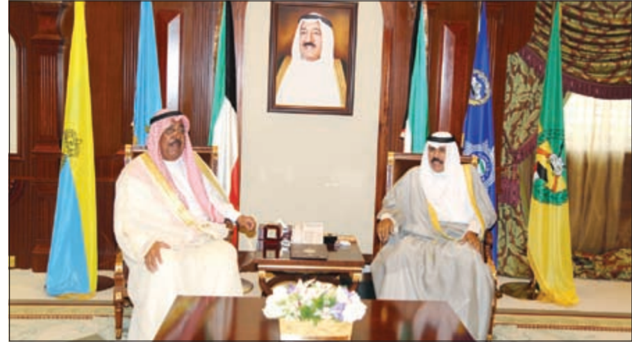
سمو ولي العهد الشيخ نواف الأحمد أثناء استقباله الشيخ جابر الخالد

استقبل سمو ولي العهد الشيخ نواف الأحمد بقصر بيان صباح أمس نائب رئيس مجلس الوزراء ووزير الدفاع الشيخ خالد الجراح. واستقبل سموه بقصر بيان صباح أمس رئيس ديوان المحاسبة عبدالعزيز العدساني. واستقبل سموه الشيخ جابر الخالد. كما استقبل سمو ولي العهد رئيس جهاز الأمن الوطني الشيخ فامر العلي.