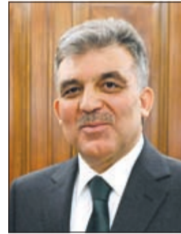
الرئيس عبد الله غول

يصل إلى البلاد اليوم الرئيس عبدالله غول رئيس جمهورية تركيا الصديقة والوفد الرسمي المرافق له في زيارة رسمية للبلاد تستغرق ثلاثة أيام، يجري فخامته خلالها مباحثات رسمية مع صاحب السمو الأمير الشيخ صباح الأحمد. وشكلت العلاقات الكويتية - التركية منذ نشأتها في بدايات القرن الماضي نموناً يحتذى به في العلاقات الدولية وذلك لما اتسمت به من مصداقية وتعاون ووحدة رأي في العديد من المواقف والأزمات التي تعرض لها البلدان الصديقان. وارتبطت الكويت وتركيا بعلاقات مميزة وفريدة من نوعها قائمة على الثقة والاحترام المتبادل منذ أيام الدولة العثمانية، ما كان له الأثر الكبير في استقرار الكويت من جهة وفي إيجاد أرضية صلبة ارتكزت عليها العلاقات الكويتية - التركية من جهة أخرى. وتأتي زيارة الرئيس التركي عبدالله غول للكويت لتضع لبننة جديدة في