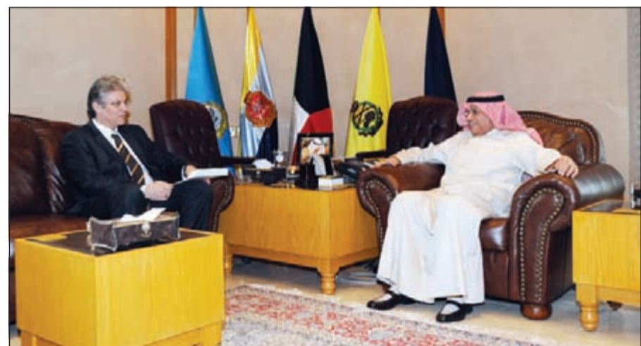
الشيخ خالد الجراح مستقبلاً السفير السلوفاكي

استقبل نائب رئيس مجلس الوزراء ووزير الدفاع خالد الجراح سفير جمهورية سلوفاكيا لدى البلاد د. أيفان لانشاريس، تم خلال اللقاء تبادل الأحاديث الودية، ومناقشة أهم الأمور والمواضيع ذات الاهتمام المشترك. هذا، وأشاد نائب رئيس مجلس الوزراء ووزير الدفاع بعقد العلاقات بين البلدين الصديقين، وحرص الطرفين على تعزيزها وتطويرها. إلى ذلك، وبمبادرة كريمة، قام نائب رئيس مجلس الوزراء ووزير الدفاع الشيخ خالد الجراح بمكتبته صباح أمس بتكريم الرائد د. حقيقي عيسى عبدالله بدو، لحصوله على شهادة الدكتوراه بالقانون العام من جمهورية مصر العربية الشقيقة، حيث قام بتقديم التهنئة للرائد الدكتور نجابة عن منتسبي وزارة الدفاع.