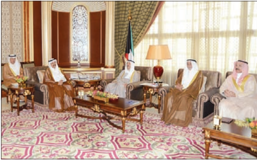
صاحب السمو الأمير الشيخ صباح الأحمد خلال استقباله المستشار فيصل المرشد وأعضاء المجلس الأعلى للقضاء

استقبل صاحب السمو الأمير الشيخ صباح الأحمد بقصر بيان صباح أمس رئيس المجلس الأعلى للقضاء ورئيس المحكمة التمييز رئيس المحكمة الدستورية المستشار فيصل المرشد والمستشارين أعضاء المجلس الأعلى للقضاء. واستقبل صاحب السمو الأمير الشيخ صباح الأحمد بقصر بيان ظهر أمس النائب الأول لرئيس مجلس الوزراء ووزير الخارجية الشيخ صباح الخالد. واستقبل صاحب السمو الأمير الشيخ صباح الأحمد بقصر بيان صباح أمس رئيس ديوان المحاسبة عبدالعزيز العدساني. هذا، وبعث صاحب السمو الأمير ببرقية تهنئة إلى الجنرال بيتر كوسجروف حاكم عام أستراليا الصديقة عبر فيها سموه عن خالص تهانئه بمناسبة توليه مهامه الدستورية حاكماً عاماً لأستراليا الصديقة، متمنياً سموه له كل التوفيق والسداد ودوام الصحة والعافية. وبعث سمو ولي العهد الشيخ نواف الأحمد ببرقية تهنئة إلى الجنرال بيتر كوسجروف حاكم عام أستراليا الصديقة ضمنها خالص تهانئه بمناسبة توليه مهامه الدستورية حاكماً عاماً لأستراليا الصديقة. كما بعث سمو رئيس مجلس الوزراء الشيخ جابر المبارك ببرقية تهنئة مماثلة.