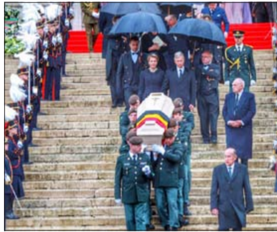
جانب من مراسم التشييع