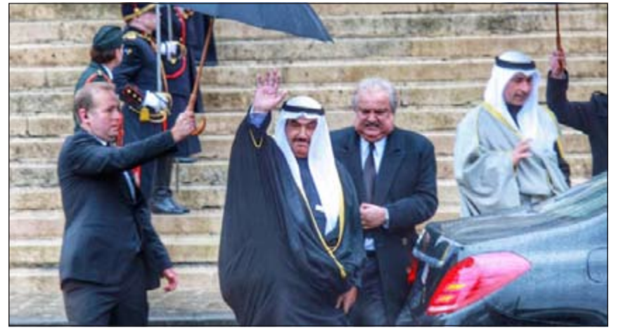
سمو الشيخ ناصر المحمد خلال مشاركته في مراسم التشييع

سفيرنا لدى بلجيكا ضرار رزوقي وعدد من أعضاء السفارة ومسؤولون بلجيكيون. وكانت الملكة فابيولا قد توفيت يوم الجمعة الماضي عن عمر ناهز الـ 86 عاما.