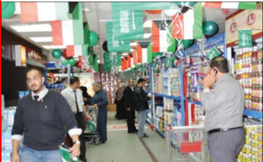
جانب من السلع المعروضة في المهرجان