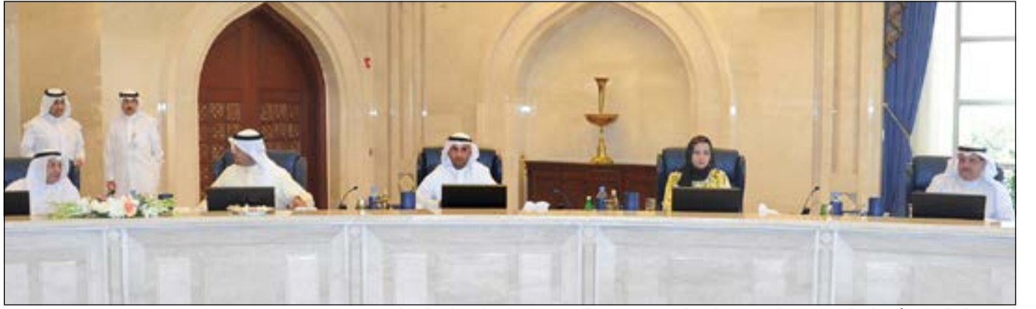
الشيخ خالد الجراح وأنس الصالح ود. نايف الحجرف ونكري الرشيد وعيسى الكندري خلال اجتماع مجلس الوزراء

وتحديد تبعيتها وتنظيم أعمالها ومواردها والذي تم إعداده بالتعاون مع خبراء فنيين من صندوق النقد الدولي في نطاق المساعدة الفنية المقدمة للكويت، وذلك تماشياً مع المعايير الدولية ذات العلاقة وقد قرر المجلس الموافقة على مشروع القرار بشأن إنشاء وحدة التحريات المالية الكويتية.