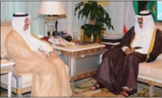
سمو نائب الأمير خلال لقائه السفير مساعد الهارون

كما استقبل سمو نائب الأمير وولي العهد الشيخ نواف الأحمد في ديوانه بقصر السيف صباح امس رئيس جهاز الأمن الوطني الشيخ ثامر العلي. واستقبل سموه بقصر السيف صباح امس سفيرنا لدى جمهورية مصر العربية سالم الزمانان. كما استقبل سمو نائب