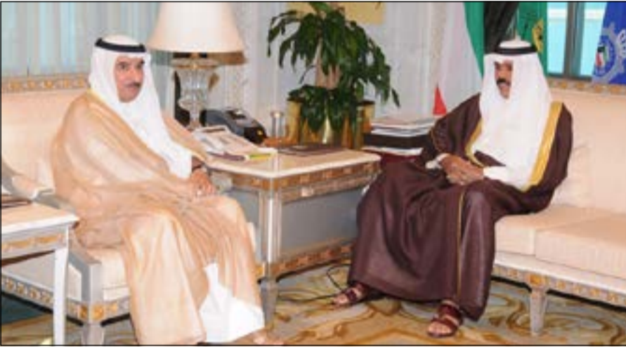
سمو نائب الأمير وولي العهد الشيخ نواف الأحمد مستقبلاً السفير سالم الزمانان