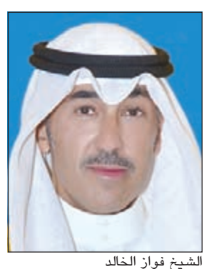
الشيخ فواز الخالد

بأحرف من نور. وقال محافظ الأحمدى: إن الأمتين العربية والإسلامية فقدتا قائداً حكيماً وزعيماً من أبرز زعمائهما، مؤكداً أن سجل الزمن سيظل يذكر للفقيد الراحل مواقفه الوطنية، وما حققه من إنجازات عديدة في الدفاع عن قضايا العربوية والإسلام، ودوره البارز في المصالحات العربية ولم الشمل والحفاظ على وحدة الصف، ودعم القضايا العربية والإسلامية، وموازنته وتعزيزه