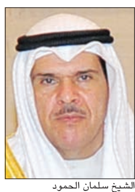
الشيخ سلمان الحمود

والإسلامية فقدت أحد فرسانها وقادتها الكبار الذين حملوا أمانة المسؤولية على مدى عقود ففكر وعمل واتسم بالصدق والحق والعدل وشجاعة الكلمة والموقف ما كان له الأثر البالغ والفعال في رفعة شأن المملكة العربية السعودية الشقيقة اقليمياً ودولياً وتوثيق عرى التعاون الخليجي والعربي والعالمى.