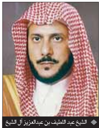
الشيخ عبد اللطيف بن عبدالعزيز آل الشيخ

اعترضوا عليها أو أنكروا على من فيها من الباعة وكانوا يحظون بالاحترام الوافر والتقدير عند ولاة الأمر وعند هيئة كبار العلماء في المملكة سابقا في الرياض. كما أشاد بما كانت عليه الرياض قبل أربعين عاماً "عندما كانت تزخر بالكثير من الباعة رجالات ونساء، مثل سوق المقبيرة وسوق حلة القصمان شرقاً وسوق منقوحة جنوباً وكان الناس لا يرون من ينكر عليهم أو يعكر صفوهم". وأضاف أن "العلماء الكبار كانوا يعلمون بهذه الأسواق ولم نسمع عنهم أنهم