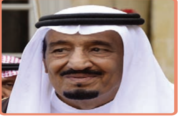
سلمان بن عبد العزيز 79 عاماً