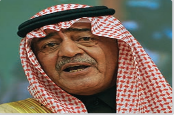
مقرن بن عبد العزيز 69 عاماً