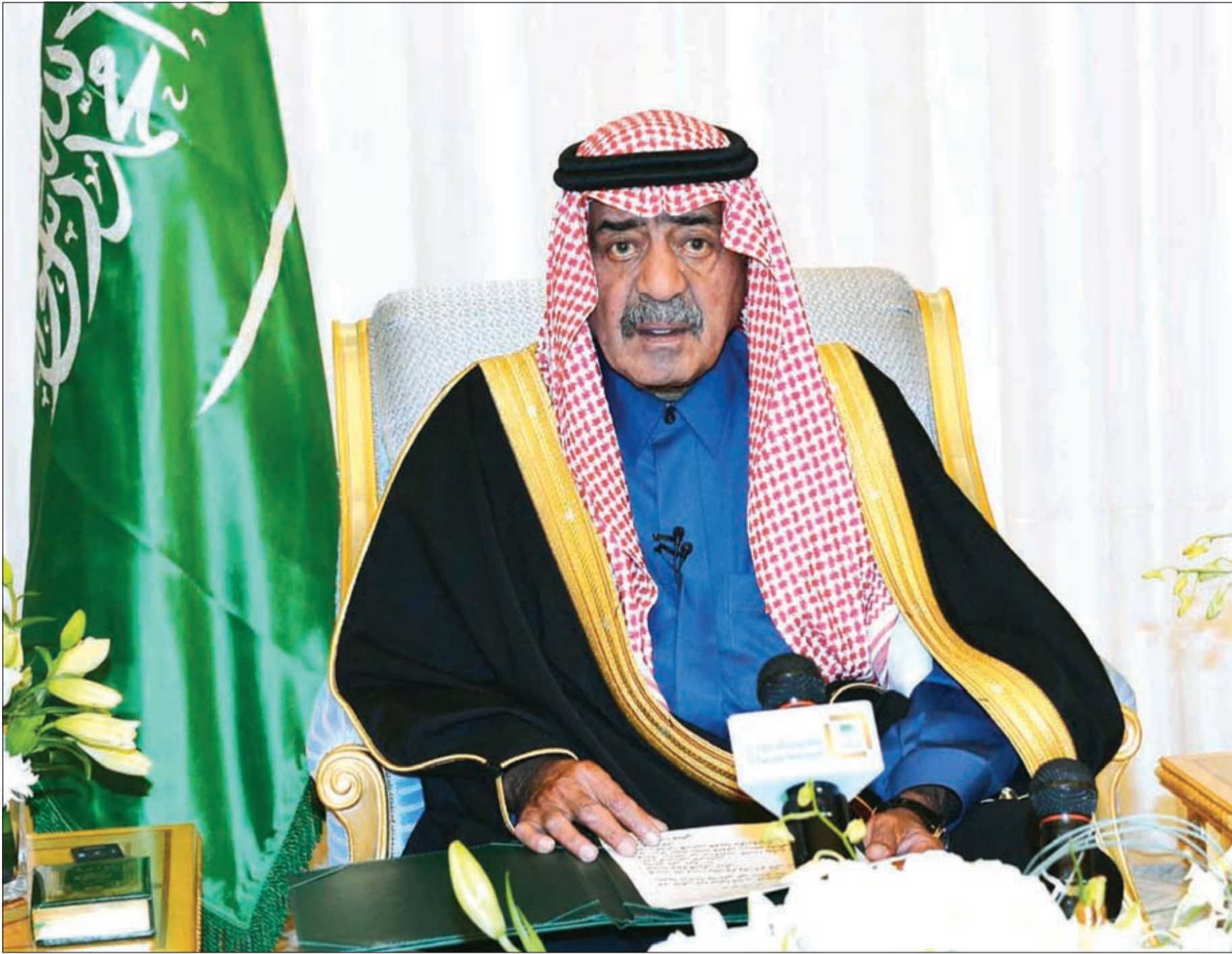
ولي العهد النائب الأول لرئيس مجلس الوزراء السعودي صاحب السمو الملكي الأمير مقرن بن عبدالعزيز ملقياً كلمته

الرياض - وكالات: قال ولي العهد النائب الأول لرئيس مجلس الوزراء السعودي صاحب السمو الملكي الأمير مقرن بن عبدالعزيز أمس إن حياة خادم الحرمين الشريفين الملك عبدالله بن عبدالعزيز حافلة بنصرة قضايا الأمتين العربية والإسلامية في كل مكان. وأضاف في كلمة نشرتها وكالة الأنباء السعودية نعى فيها الملك عبدالله «شعنا إرادة المولى تعالى، وانتقل إلى جوار ربه خادم الحرمين الشريفين الملك عبدالله بن عبدالعزيز، تغدده الله بواسع رحمته بعد حياة حافلة بطاعة المولى سبحانه وتعالى ونصرة قضايا الأمتين العربية والإسلامية في كل مكان وخدمة وطننا الغالي وشعبه الوفي الذي بادله الحب والوفاء والإخلاص بصورة منقطعة النظير قل مثلها بين القادة وشعوبها، فنسال الله العلي القدير أن يجزيه خير الجزاء على ما قدم. وتابع: «وإننا إذ ننعى إلى شعبنا الوفي رحيل الوالد القائد لنسال الله تعالى أن يشمله برحمته الواسعة ومغفرته، كما نسأله تعالى أن يوفق سيدي خادم الحرمين الشريفين الملك سلمان بن عبدالعزيز إلى ما فيه خير بلاننا العزيزة وشعبها النبيل ونصرة قضايا الأمتين العربية والإسلامية في هذا الوقت الحرج الذي تمر به الأمة والذي هو بأمس الحاجة إلى حكمة وخبرة مقامه الكريم التي استمدت من عمله السياسي الدؤوب الذي اضطلع به منذ نشأته في عهد الوالد المؤسس الملك عبدالعزيز». وكان ولي العهد النائب الأول لرئيس مجلس الوزراء