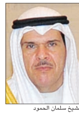
الشيخ سلمان الحمود

والإسلامية فقدت أحد فرسانها وقادتها الكبار الذين حملوا أمانة المسؤولية على مدى عقود ففكر وعمل واتسم بالصدق والحق والعدل وشجاعة الكلمة والموقف ما كان له الأثر البالغ والفعال في رفعة شأن المملكة العربية السعودية الشقيقة اقليمياً ودولياً وتوثيق عرى التعاون الخليجي والعربي والعالمى.