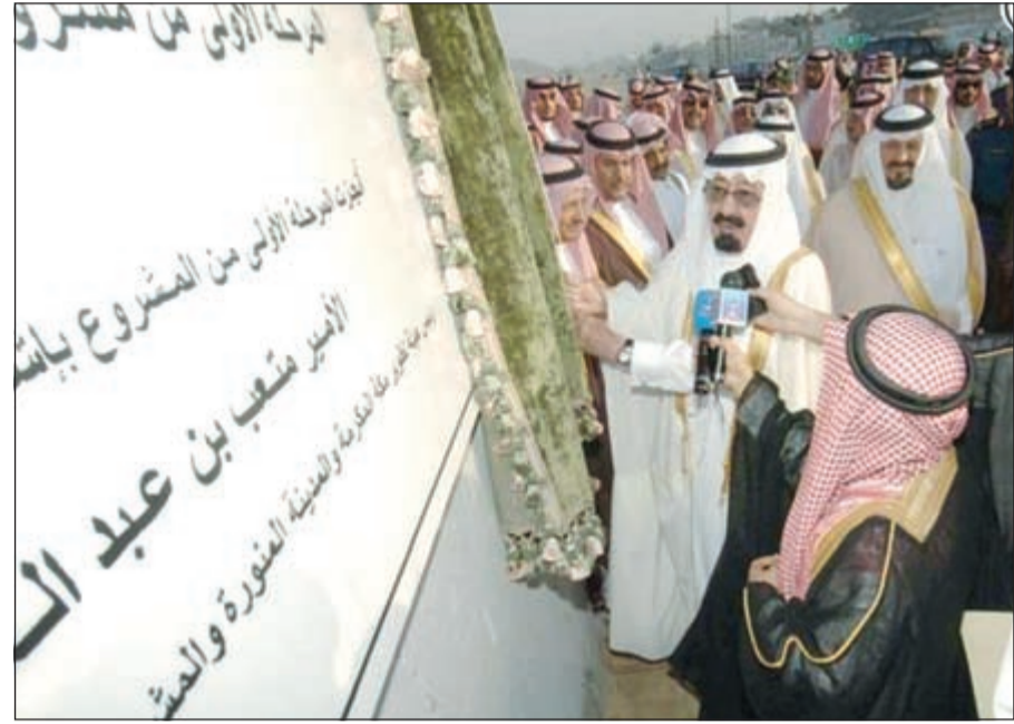
الملك الراحل بزيح الستار عن أحد المشاريع الاقتصادية في مكة

المحلية. وفي عهد الملك الراحل تم إنشاء هيئة مكافحة الفساد على أن تكون مرتبطة بالملك مباشرة. وعلى صعيد المشروعات المنورة وتبوك وحائل وجيزان والطائف والقصيم والجوف والباحة وعمرعمر ونجران. وتم وضع حجر الأساس لمشروعات عملاقة في جدة ومكة المكرمة تفوق كلفتها 600 مليار ريال تحت مسمى «نحو العالم الأول». كما شارك، رحمه الله، في مؤتمر قمة العشرين الاقتصادية العالمية والتي انعقدت في واشنطن 2008. للازمة والتي أعلن خلالها رصد المملكة مبلغ 400 مليار لمعالجة الأزمة المالية العالمية ولدفع عجلة التنمية والنهضة في المملكة وضمان عدم توقف مشاريع التنمية بها ولدعم وحماية المصارف