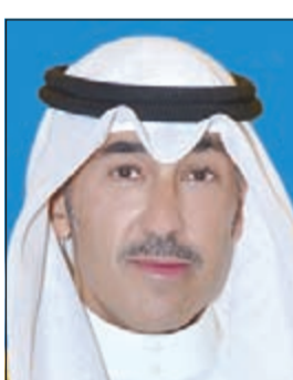
الشيخ فواز الخالد

بأحرف من نور. وقال محافظ الأحمدى: إن الأمتين العربية والإسلامية فقدتا قائداً حكيماً وزعيماً من أبرز زعمائهما، مؤكداً أن سجل الزمن سيظل يذكر للفقيد الراحل مواقفه الوطنية، وما حققه من إنجازات عديدة في الدفاع عن قضايا العربوية والإسلام، ودوره البارز في المصالحات العربية ولم الشمل والحفاظ على وحدة الصف، ودعم القضايا العربية والإسلامية، وموازنته وتعزيزه