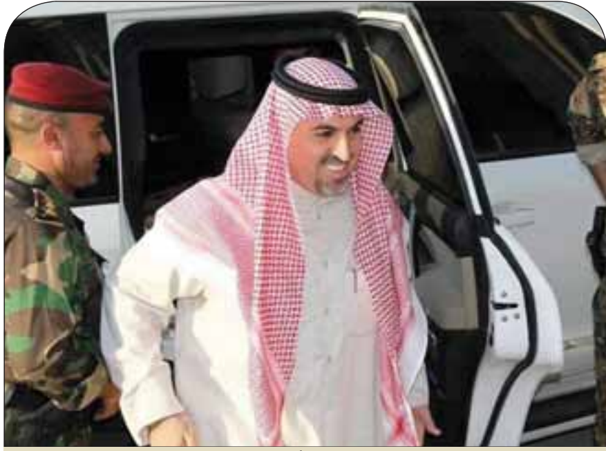
النائب المعتقل أحمد العلواني