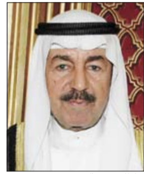
سلطان بن حثلين

وشدد على حرص خادم الحرمين على تسخير جميع الموارد الوطنية لخدمة الوطن والمواطن، حيث نهضت المملكة نهضة نوعية في شتى المجالات على الرغم من صعوبة التطورات والظروف الإقليمية والدولية التي أحاطت بالمنطقة مؤخرا.