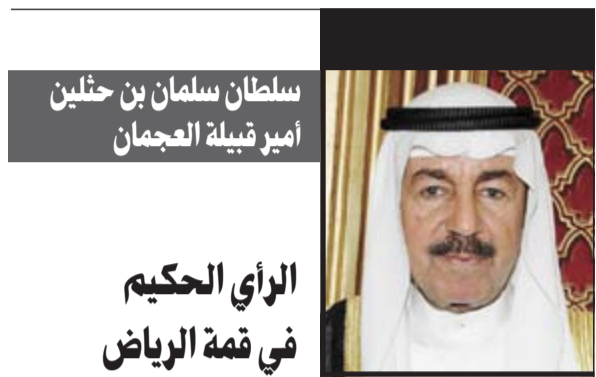
سلطان سلمان بن حثلين أمير قبيلة العجمان