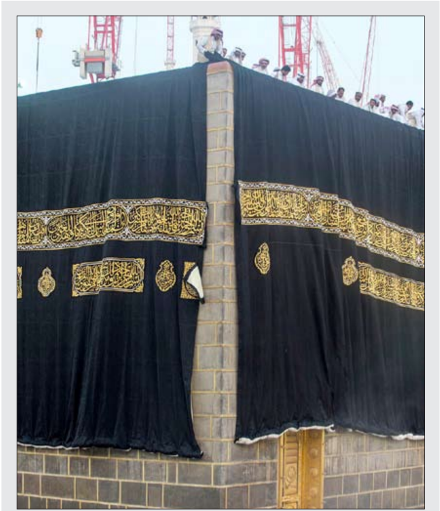
الكعبة أثناء تليسيها الكسوة