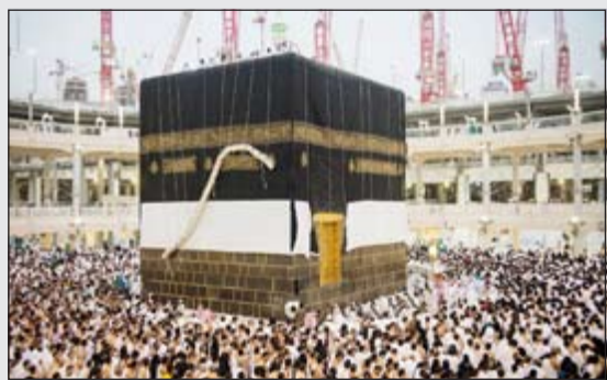
الكعبة ترتدي كسوتها

وجرت عملية استبدال الثوب بحضور منسوبي الرئاسة العامة لشؤون المسجد الحرام والمسجد النبوي الشريف ومصنع كسوة الكعبة المشرفة، حيث قاموا بنقل الثوب الجديد إلى الحرم الشريف والمكون من أربعة جوانب مفرقة وستارة الباب، حيث تم رفع كل جنب من جوانب الكعبة الأربعة على حدة، إلى أعلى الكعبة المشرفة ثم فربها على الجنب القديم وتثبيت الجنب من أعلى الكعبة المشرفة.