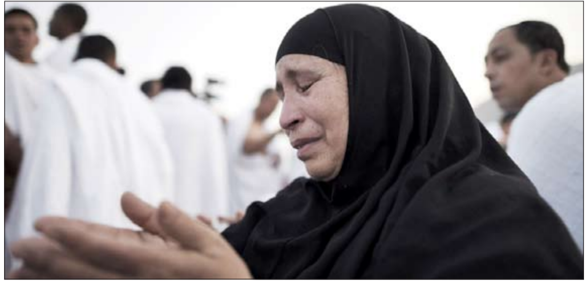
حاجة تدعو ربها يوم عرفات

أسرية مثلاً.. في يومين وجب عليه رمي الجمرات الثلاث في اليوم الثاني عشر لشهر ذي الحجة (الثلاثاء)، ومغادرة منى قبل غروب الشمس. وبعد رمي الجمرات في آخر أيام الحج، يتوجه الحاج إلى مكة المكرمة للطواف حول البيت العتيق طواف الوداع، وآخر واجبات الحاج قبيل سفره مباشرة.