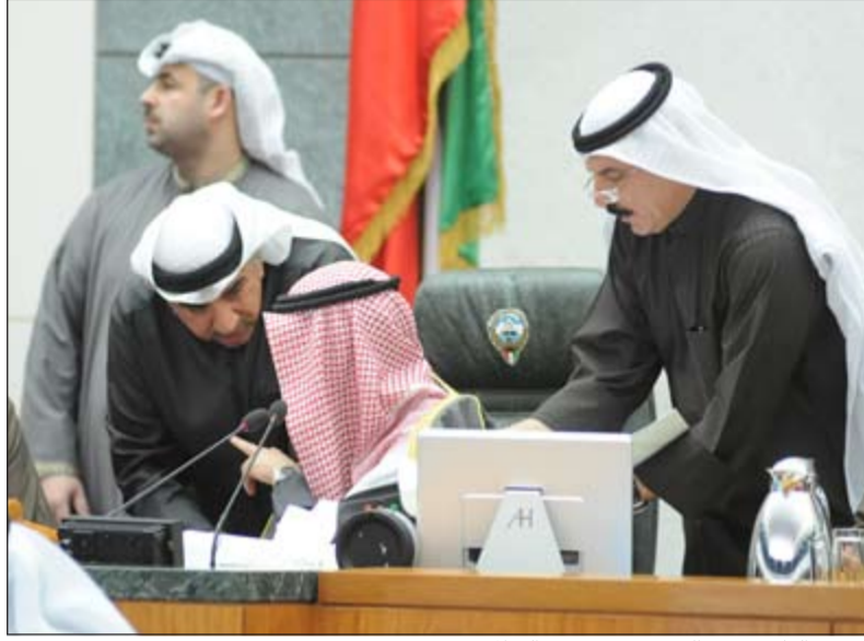
الرئيس الغانم ود.عبدالحاميد دشتي وعبدالله المعروف