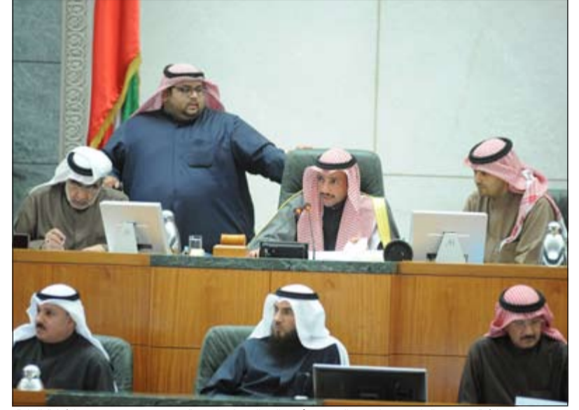
رئيس مجلس الأمة مرزوق الغانم وعبدان عبدالصمد وأنس الصالح على المنصة ويبدو بدر ششتري والأمانة العامة

العالي لديهم حسابات مع «التأمينات». بالنسبة لهيئة التطبيقي، استعانت بالأجانب وأعطوهم رواتب عالية في وقت كانت العقود على 150 ديناراً، ورد الوزير بأن الموضوع معروض على القضاء، لكن الأمر لم يعرض على القضاء ووجهت سؤالاً ملحفاً بشأن قرار الإحالة إلى القضاء ولم يصنني شيء لأنه لم يحل إلى القضاء. مدير عام التطبيقي يعطي الوزير إجابات مغلوطة عن مخالفات التطبيقي، هناك تجاوزات، نشروا