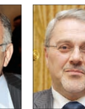
محمد بحر العلوم