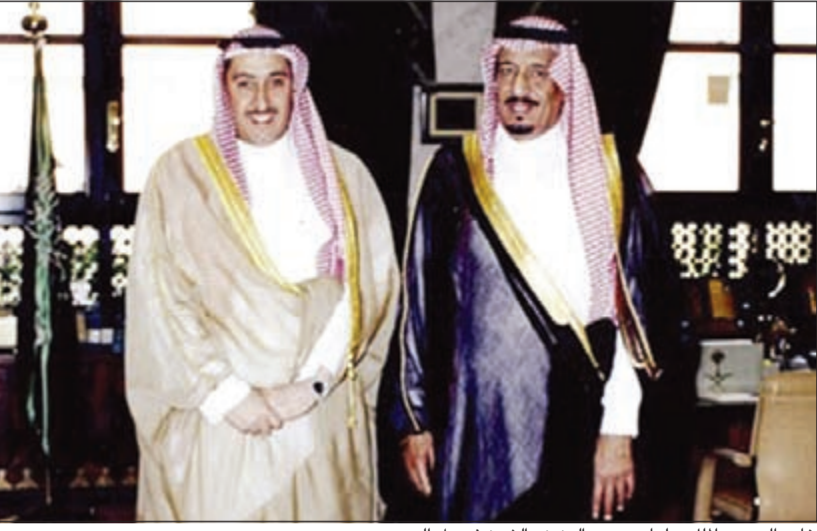
خادم الحرمين الملك سلمان بن عبدالعزيز والشيخ فيصل الحمود

وأضاف الحمود أن مبايعة الأمير سلمان بن عبدالعزيز ملكاً للمملكة العربية السعودية ستكون لها انعكاساتها الأكثر من إيجابية على الواقع العربي ولم الشمل، واصفاً إياه بـرجل المرحلة الذي يخوض غمار الصعوبات التي يمر بها العالم العربي والإسلامي، وقائد السفينة المحنك الذي يبحر بها إلى بر الأمان. وبين أنه إذا كانت الأمة قد فقدت رجلاً عظيماً حكيمًا فإن لها في الملك سلمان عزاء كبيراً، فهو سليل الأسرة الكريمة ورجل علمته الأيام الكثير، وقد عرفته عن قرب رجلاً مقداماً حريصاً على وحدة الصف العربي، وله من المواقف الوطنية والإنسانية الكثير ما يجعله خير خلف لخير سلف.