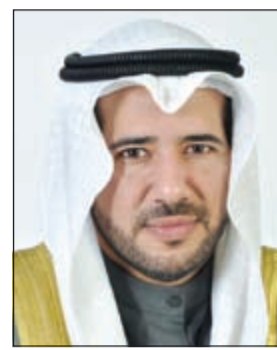
الشيخ عبدالله الأحمد

وقال اني اتوجه الى المملكة العربية السعودية الشقيقة بخالص العزاء لرحيل الملك عبدالله بن عبدالعزيز هذه الشخصية الفذة التي فقدتها الأمة العربية والإسلامية وعزأونا ان المملكة في أيد أمينة لاستكمال الدور المميز لاسيما في مجلس التعاون الخليجي.