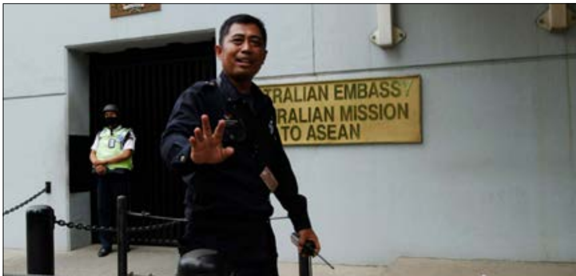
رجل امن يحاول منع الاعلام من التصوير امام السفارة الاسترالية في جاكرتا

لندن شارك فيه من واشنطن «في بعض الحالات، أقر لكم، كما فعل الرئيس (الأميركي باراك أوباما)، بأن بعضاً من هذه التصرفات ذهب بعيداً جداً وسوف نحرص على ألا يتكرر هذا الأمر في المستقبل»، مبرراً هذه الممارسات بضرورة مكافحة الإرهاب.