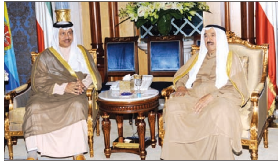
صاحب السمو الأمير الشيخ صباح الأحمد مستقبلاً سمو رئيس الوزراء الشيخ جابر المبارك

السعودية الشقيقة تتعلق بالعلاقات الإخوية المتميزة التي تربط بين البلدين والشعبين الشقيقين والقضايا العربية التي تهمنا جميعاً. والاهتمام المشترك وآخر المستجدات على الساحتين الإقليمية والدولية. وحضر المقابلة نائب رئيس مجلس الوزراء وزير الخارجية الشيخ صباح الخالد ونائب وزير شؤون الديوان الأميري الشيخ علي