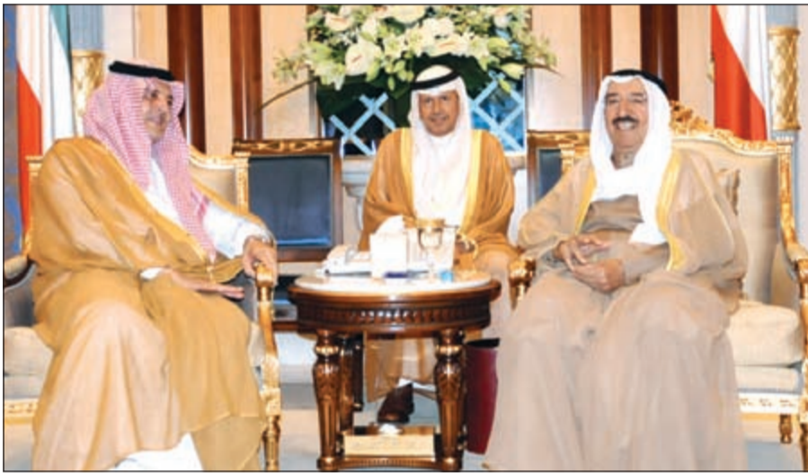
صاحب السمو الأمير الشيخ صباح الأحمد أثناء استقباله صاحب السمو الملكي الأمير سعود الفيصل

الجراح، وكان وزير خارجية المملكة العربية السعودية الشقيقة الأمير سعود الفيصل آل سعود وصل إلى الكويت صباح أمس في زيارة رسمية للبلاد. وكان في استقبال الأمير الفيصل على أرض المطار نائب رئيس مجلس الوزراء وزير الخارجية الشيخ صباح الخالد ووكيل وزارة الخارجية السفير خالد الجارالله ومدير إدارة مكتب نائب رئيس مجلس الوزراء وزير الخارجية السفير الشيخ د. أحمد ناصر المحمد ومدير إدارة المراسم السفير ضاري العجران ومدير إدارة شؤون مجلس التعاون السفير ناصر حجي المزين وعدد من كبار المسؤولين في وزارة الخارجية.