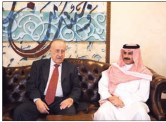
الشيخ مبارك الدعيج خلال استقباله نقيب الصحفيين اللبنانيين إلياس عون

استقبل رئيس مجلس الإدارة والمدير العام لوكالة الأنباء الكويتية، كونه، الشيخ مبارك الدعيج في مكتبه أمس نقيب الصحفيين اللبنانيين إلياس عون يرافقه الإعلامي اللبناني أحمد شمس الدين الياس. وتم خلال اللقاء تناول القضايا الإعلامية المختلفة لاسيما عملية تطوير الإعلام العربي بما يمكنه من منافسة الإعلام العالمي. وشهد الشيخ مبارك الدعيج على أهمية مد جسور التواصل والتعاون بين مختلف المؤسسات الإعلامية العربية من أجل تبادل الأفكار والخبرات والمعلومات وتوحيد الرؤى تجاه القضايا التي تهم العالم العربي، من ناحية، وأشار عون إلى أن الإعلام العربي شهد خلال السنوات الماضية تطوراً ملموساً غير أنه أوضح أن عملية تطوير الإعلام والارتقاء بمستوى الخطاب الإعلامي العربي ما زالت في حاجة إلى مزيد من الجهود للوصول إلى المستوى المطلوب.