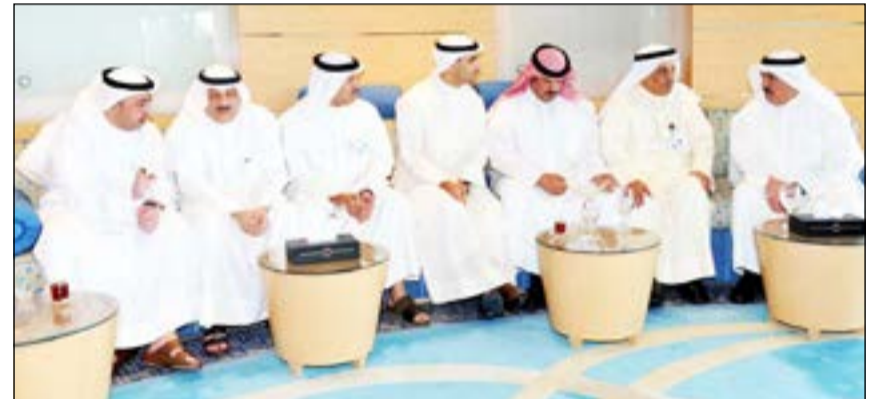
الشمالي والشيخ طلال الخالد ومحمد الغرود وعلي العبيد خلال استقبال المهنيين بالعيد

قال نائب رئيس مجلس الوزراء ووزير النفط مصطفى الشمالي أن حفل وضع حجر أساس مجمع التكرير والبتروكيماويات في فينتام المشترك لشركة البترول الكويتية العالمية التابعة لمؤسسة البترول الكويتية باكورة عمل المؤسسة خلال العام الحالي، أملا أن يكون المشروع بريق خير لمزيد من الإنجازات المستقبلية خلال الفترة المقبلة. وحول تطور مشروع مصفاة الصين، أشار الوزير الشمالي على هامش حفل استقبال المهنيين بعيد الأضحى المبارك، أمس، بحضور عدد من القيادات النفطية إلى أن المشروع لا يزال تحت الدراسة والمناقشة مع المسؤولين الصينيين. وردا على تساؤل حول إشاعات خروج الكويت من مصفاة الصين رد الوزير باستغراب نافيا وجود أي نية لدى الكويت للخروج من مشروع مصفاة ومجمع بتروكيماويات الصين. إلى هذا، قالت مؤسسة البترول الكويتية في بيان صحافي أمس أن الوزير مصطفى الشمالي سيغادر البلاد اليوم مترشفا وندا رفيع المستوى للمشاركة في حفل وضع حجر أساس مجمع التكرير والبتروكيماويات في فينتام المشترك لشركة البترول الكويتية العالمية التابعة لمؤسسة البترول الكويتية منشنيا بذلك عمليات التشييد والبناء.