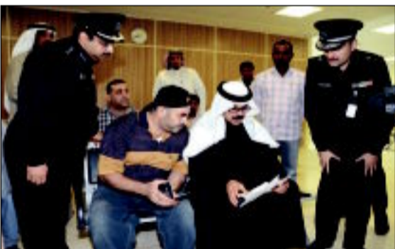
وزير الداخلية متابعاً مع أحد المراجعين