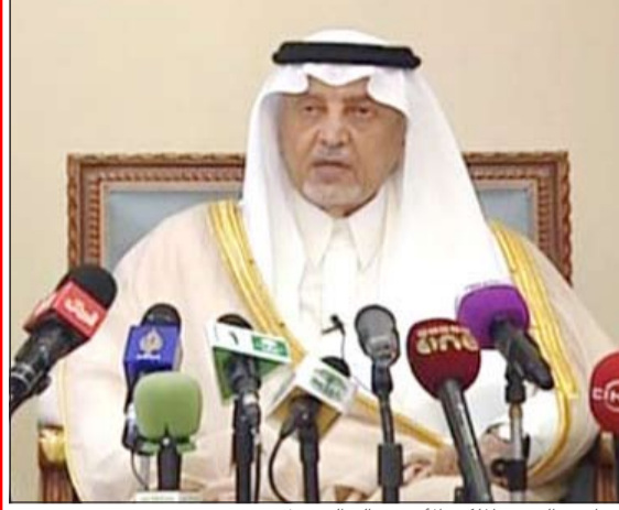
صاحب السمو الملكي الأمير خالد الفيصل