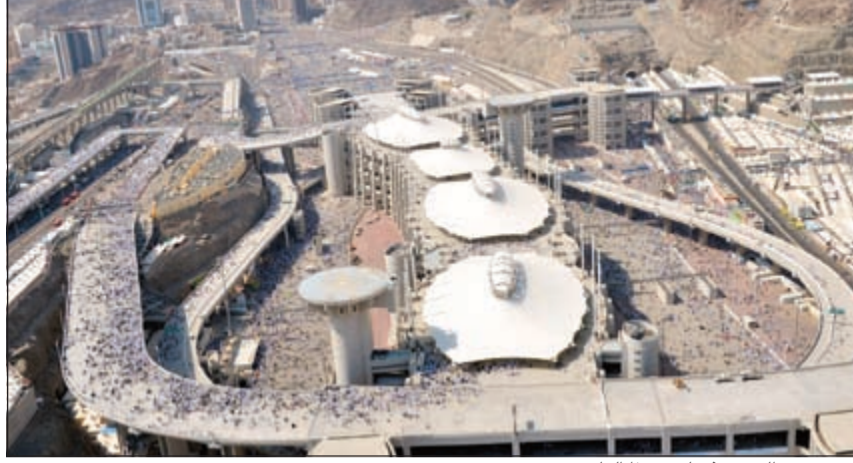
صورة من الجو توثق لحج هذا العام

القوانين». وكشف أن الدول تجاوبت بطريقة رائعة مع سياسات تخفيض أعداد الحجاج خلال العام الحالي. وحول مشروع توسعة الحرم المكي، قال إنه سينتهي خلال فترة زمنية تتراوح من عام إلى عام ونصف العام، وأنها ستمكّن أكثر من مليون و200 ألف شخص من الصلاة داخل الحرم.