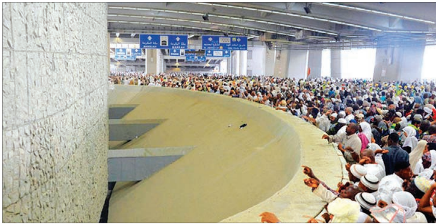
الحجاج في ثاني «أيام التشريق»

تنقل الحجاج، حيث تم نقل نحو 40٪ من الحجاج عبر نظام النقل بالرحلات الترددية، بينما تستخدم 25٪ تقريبا «قطار المشاعر»، وقد تم نقل نحو 35٪ السير على الأقدام، أو استخدام الرحلات التقليدية عبر السيارات والحافلات الخاصة.