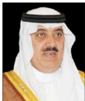
الأمير متعب بن عبدالله بن عبدالعزيز

غير أن السيناتور الجمهوري النافذ ليندسي غراهم المتخصص في السياسة الخارجية، اعتبر خلاقا لسلاطة أن التهديد بعقوبات جديدة «قد يكون أفضل طريقة للتوصل إلى حل سلمي» في هذا الملف. وأضاف أن «البرنامج النووي الإيراني سيفكك لا محالة بالديبلوماسية او بالحرب، وأنا أفضل بالديبلوماسية»، مؤكدا أن مجلس الشيوخ سيتجاهل اقتراحا من قبل نواب مجلس الشيوخ. جاء ذلك، فيما استأنفت أمس في جنيف الجولة الثانية من المفاوضات على مستوى الخبراء بين إيران ومجموعة الـ 5+1، لمحت آليات تنفيذ الاتفاق الذي تم بين الجانبين في 24 نوفمبر الماضي.