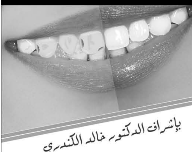
بإشراف الدكتور خالد الكندري