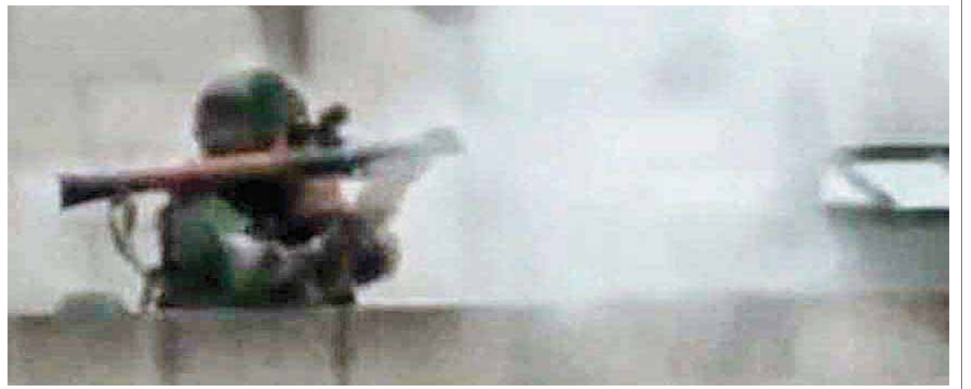
جندي سوري يقصف احد احياء حمص بـالرماية جوي