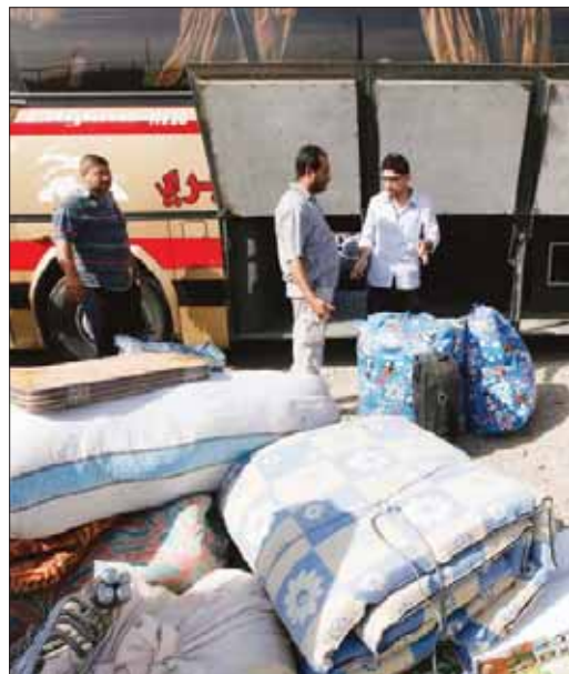
صورة التقطت مؤخرا للاجئين العراقيين فروا عائدتين الى بلدهم من سوريا بسبب الاوضاع الامنية هناك (أ.ب.)

تعرضت لاطلاق النار، وهم في طريقهم الى منطقة قولي الى الشمال من أبيي، مضيفة ان المهاجمين مجهولون. نفي جنوبي من جهته، نفي المتحدث باسم الجيش الشعبي (الجنوبي)، العقيد فيليب اقويرو الهجوم وقال من جوبا «هذا غير صحيح نهائياً، ليس هناك وجود للجيش الشعبي في أبيي والموجود هو الوحدات المشتركة