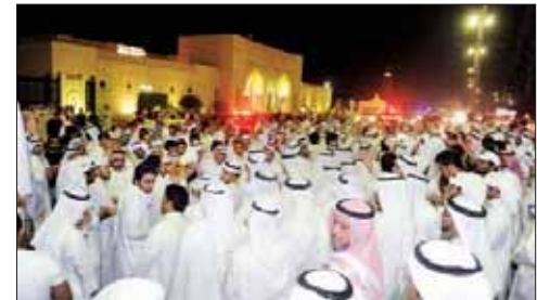
تجمع حاشد أمام مجلس الوزراء

رغم الإجراءات التي اتخذتها وزارة الداخلية من تدابير أمنية عصر امس، استيقا لتجمع «جمعة الدستور» مساء، وتواجد القوات الخاصة، فإن هذا الامر لم يمنع نحو 700 شخص من التجمع أمام ساحة الصفاة، احتجاجا على تاجيل استجواب سمو الشيخ ناصر المحمد رئيس مجلس الوزراء لمدة عام. وطالب الحضور بإسقاط حكومة محمد، والائتلاف بحكومة شعبية، ورددوا شعارات «الشعب يريد إصلاح النظام».