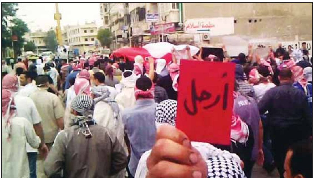
تظاهرة في حماة ومتظاهرين يرفعون لافتة حمراء وعليها: ارحل

لا سياحة.. المطاعم والفنادق والمتاجر شبه فارغة