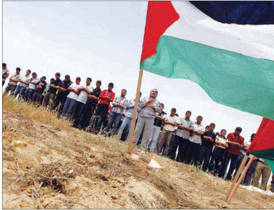
فلسطينيون يؤدون صلاة الجمعة بالقرب من الحدود مع إسرائيل في خان يونس جنوب قطاع غزة

ليفني يهاجم نتانياهو في المقابل، هاجمت رئيسة حزب كاديما والمعارضة تسيبي ليفني بشدة نتانياهو امس وقالت إنه يلحق ضرراً بالعلاقات مع أميركا ويأمن إسرائيل قدرتها على الرد. وقالت إن تصريحات مثل (ينبغي الحفاظ على التحالف) و(الصراع للبقاء الشخصي) لا تبرر الثمن الذي ستدفعه إسرائيل، ورئيس حكومة يتعامل مع الإدارة الأميركية وكأنها «عدو»، ومن جانبه، دعا رئيس لجنة الخارجية والأمن في الكنيست اي شاولوف موفاز رئيس الوزراء إلى قبول المبادئ التي عرضها الرئيس الأميركي.