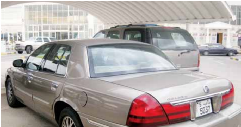
سيارة العوضي بعد أن تركها في أحد مواقف الداخلية