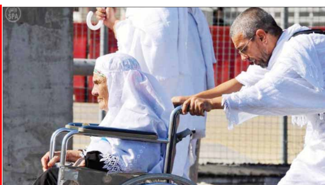
● بالوالدين إحساناً

يشار إلى أن عدد كبيراً من الحجاج يفضلون التوجه إلى عرفات مباشرة في يوم الثامن تجنباً للازدحام اليوم (السبت)، بينما يفضل آخرون البقاء في مكة المكرمة. ونقلت وكالة الأنباء السعودية الرسمية (واس) عن مسؤول حكومي قوله: إن «قوات الجوازات المحيطة بمكة المكرمة والمدينة المنورة أعادت أكثر من 89 ألف شخص لا يحملون تصاريح نظامية للحج، وقضت على قرابة 1600 شخص من المتسللين ومخالفين نظام الإقامة، ومن يحملون تصاريح مزورة».