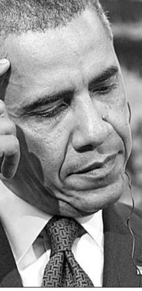
أوباما خلال مؤتمره الصحافي المشترك مع نظيره البولندي أمس

وقال أوباما بعدما تفقد وحدة مشتركة من طيارين عسكريين بولنديين وأميركيين في مطار أربسو: «التزامنا بامن بولندا وامن حلفائنا في أوروبا الوسطى والشرقية يشكل حجر زاوية لامتنا، وهو لا يُمس». وخلال مؤتمر صحافي مع