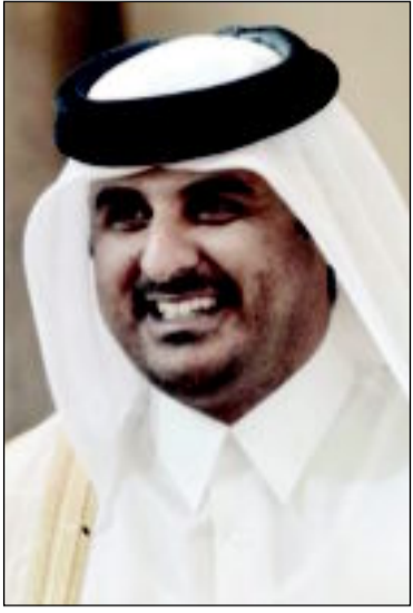
الشيخ تميم بن حمد