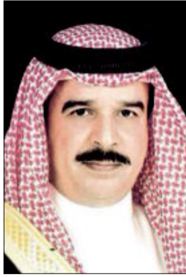
الملك حمد بن عيسى آل خليفة