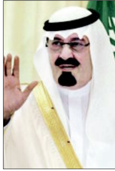
الملك عبدالله بن عبدالعزيز آل سعود