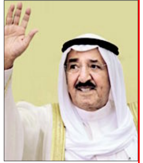
سمو الشيخ صباح الأحمد