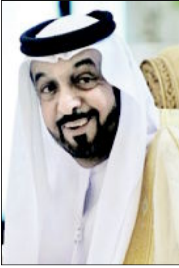
الشيخ خليفة بن زايد