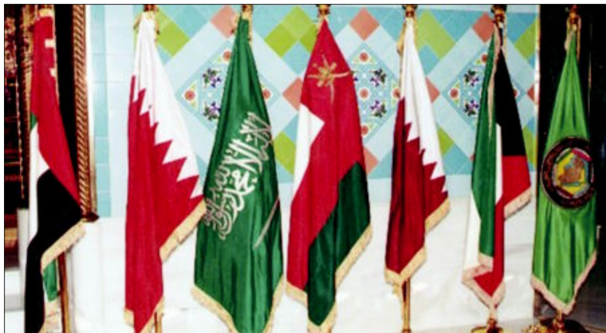
مجلس التعاون الخليجي ... روابط راسخة

لو يفرق ورقهم سادستنا قطر او ترصد عوائل نعرف انكبها شامخين بناخذ حقتنا من بطر لو تميزر عزفنا ديننا طبها